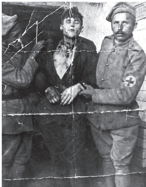
Fotografia zabitego powstańca Ignacego Haase, sierpień 1919 r., ze zbiorów Muzeum Czynu Powstańczego w Górze Świętej Anny – Oddział Muzeum Śląska Opolskiego w Opolu