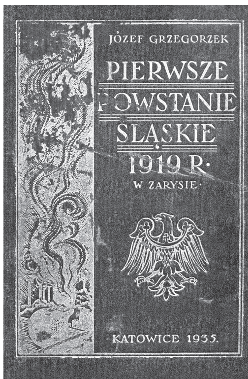
Książka Józefa Grzegorzeka pt. Pierwsze powstanie śląskie 1919 r. w zarysie , Katowice 1935, ze zbiorów Muzeum Czynu Powstańczego w Górze Świętej Anny