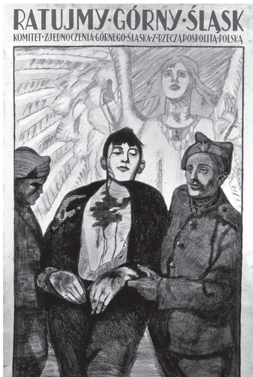
Plakat „Ratujmy Górny Śląsk”, wyd. Komitet Zjednoczenia Górnego Śląska z Rzeczypospolitą Polską, Drukarnia Litografii Artystycznej Władysława Głowczewskiego, Warszawa, 1919 r., ze zbiorów Muzeum Czynu Powstańczego w Górze Świętej Anny – Oddział Muzeum Śląska Opolskiego w Opolu