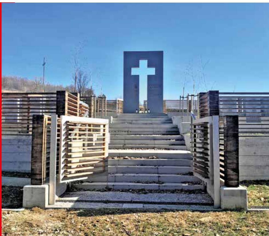
Główna oś cmentarza, schody prowadzące do pomnika, marzec 2026 r.