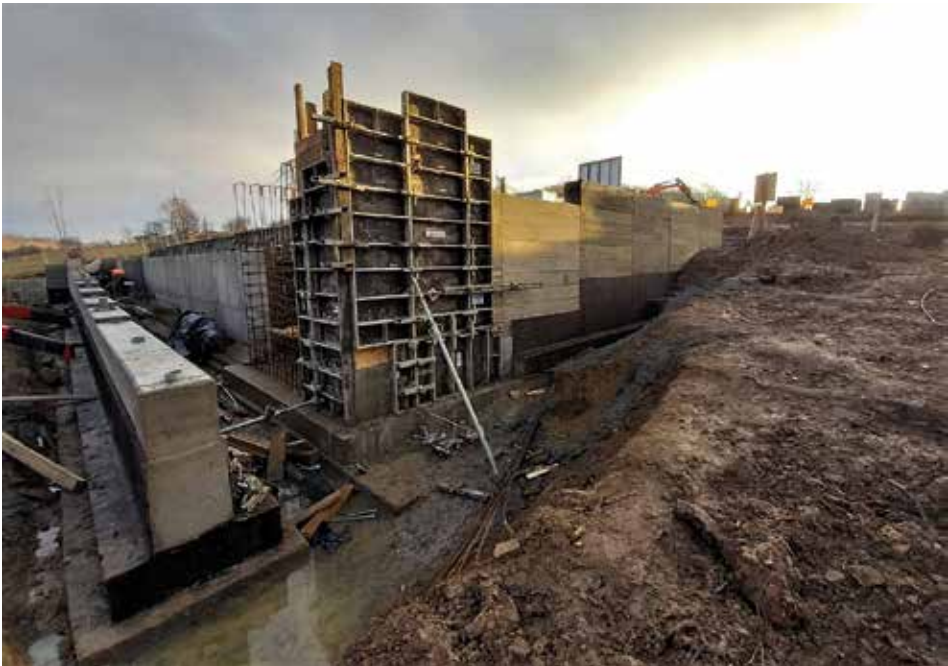
Produkcja elementów pomnika centralnego