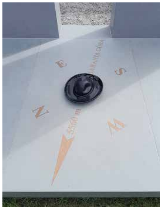
Róża wiatrów symbolicznie wskazująca Baranią Górę, na której stokach mieściły się obozy sztabu zgrupowania „Bartka”, oraz żywiecki kapelusze symbolizujący związki partyzantów z miejscową ludnością