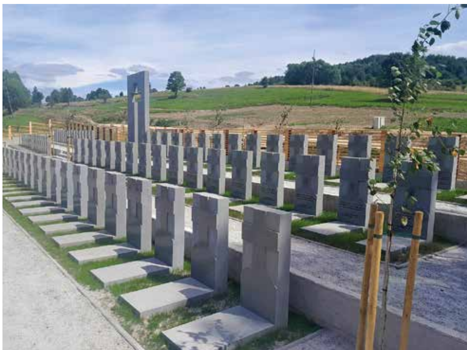
Widok na cmentarz w kierunku północnym, marzec 2026 r.