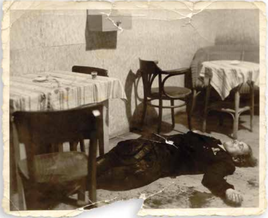
„Bartek” zastrzelony w restauracji w Zabrzegu

polskiego. Akcje likwidacyjne wobec UB i służb kierowanych przez komunistów pokazywały funkcjonariuszom aparatu represji, że nie są bezkarni nawet mimo ochrony sowieckiej i militarnej obecności ZSRS w Polsce. W gruncie rzeczy to był ostatni czas, kiedy funkcjonariusze bezpieki i ich współpracownicy, działający przeciw niepodległości państwa polskiego, bywali skutecznie pociągani do odpowiedzialności za aktywny udział w zbrodniach przeciw państwu i obywatelom.