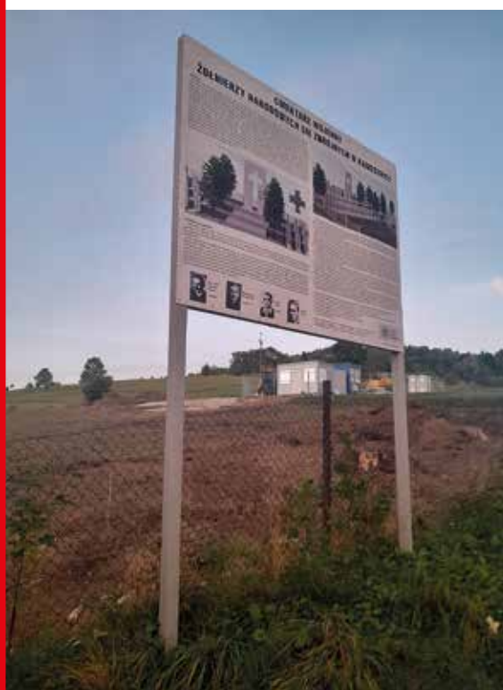
Rozpoczęcie budowy cmentarza, czerwiec 2024 r.