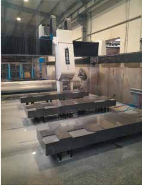
Wycinanie tablic nagrobnych w hali produkcyjnej Granity Skwara Group