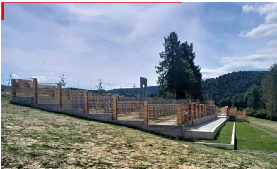
Widok na cmentarz w kierunku południowym, marzec 2026 r.