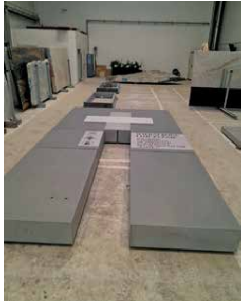
Produkcja elementów pomnika centralnego