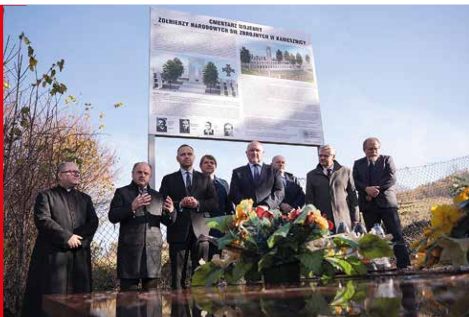
Prezentacja koncepcji cmentarza wojennego żołnierzy NSZ w Kamesznych, 26 października 2022 r.