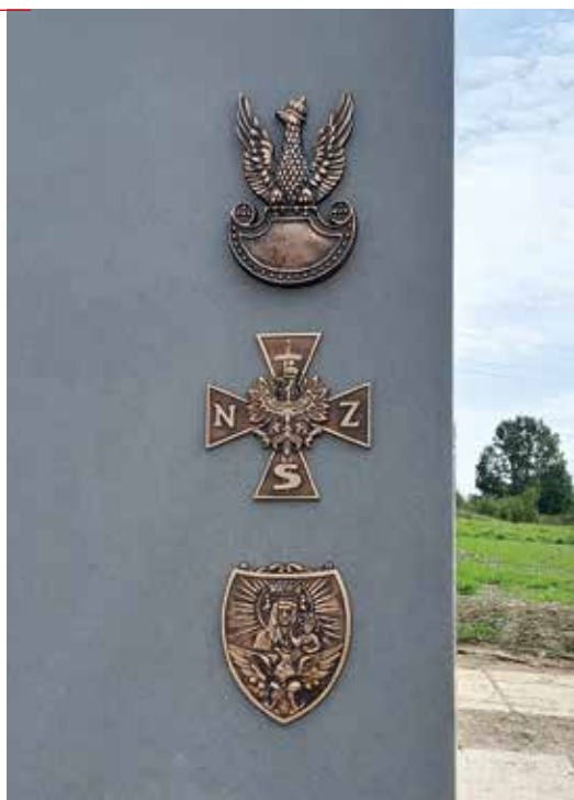
Symbole umieszczone na frontowej ścianie pomnika: orzeł Wojska Polskiego, Krzyż Narodowych Sił Zbrojnych oraz jeden z ryngrafów noszonych przez żołnierzy zgrupowania „Bartka”