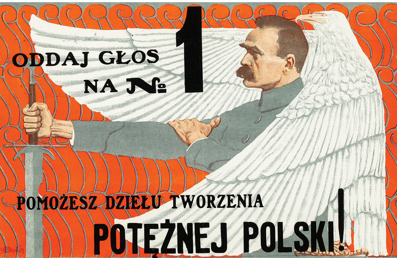
■ PLAKAT WYBORCZY BBWR Z 1928 R. WYKORZYSTUJĄCY OBRAZ OLEJNY AUTORSTWA EDWARDA OKUNIA PORTRET MARSZAŁKA JÓZEFA PIŁSUDSKIEGO NAMALOWANY W 1919 R.

znaniem się do kłęski. Co więcej, Wojciechowski dobitnie podkreślił, że to właśnie on stoi na straży honoru armii. Piłsudski przekonał się też, że żołnierze są gotowi wymierzyć broń w niego samego. Pozostawała zatem albo kapitulacja i zdanie się na łaskę przeciwników, albo orężna walka. W tym drugim wypadku drogę do stolicy należało otworzyć siłą. Most Poniatowskiego był skutecznie zablokowany, toteż oddziały stojące po stronie Marszałka mogły wykorzystać jedynie Most Kierbedzia.