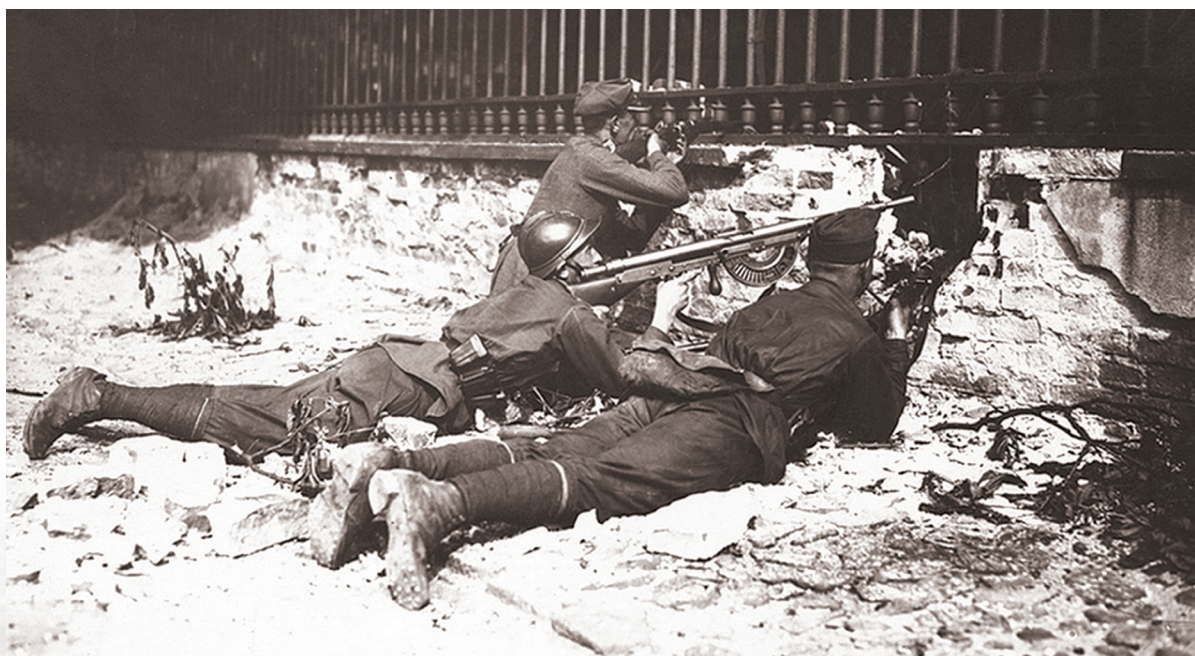
■ GRUPA ŻOŁNIERZY MARSZ. JÓZEFA PIŁSUDSKIEGO NA PLACU PRZED BELWEDEREM, MAJ 1926 R.