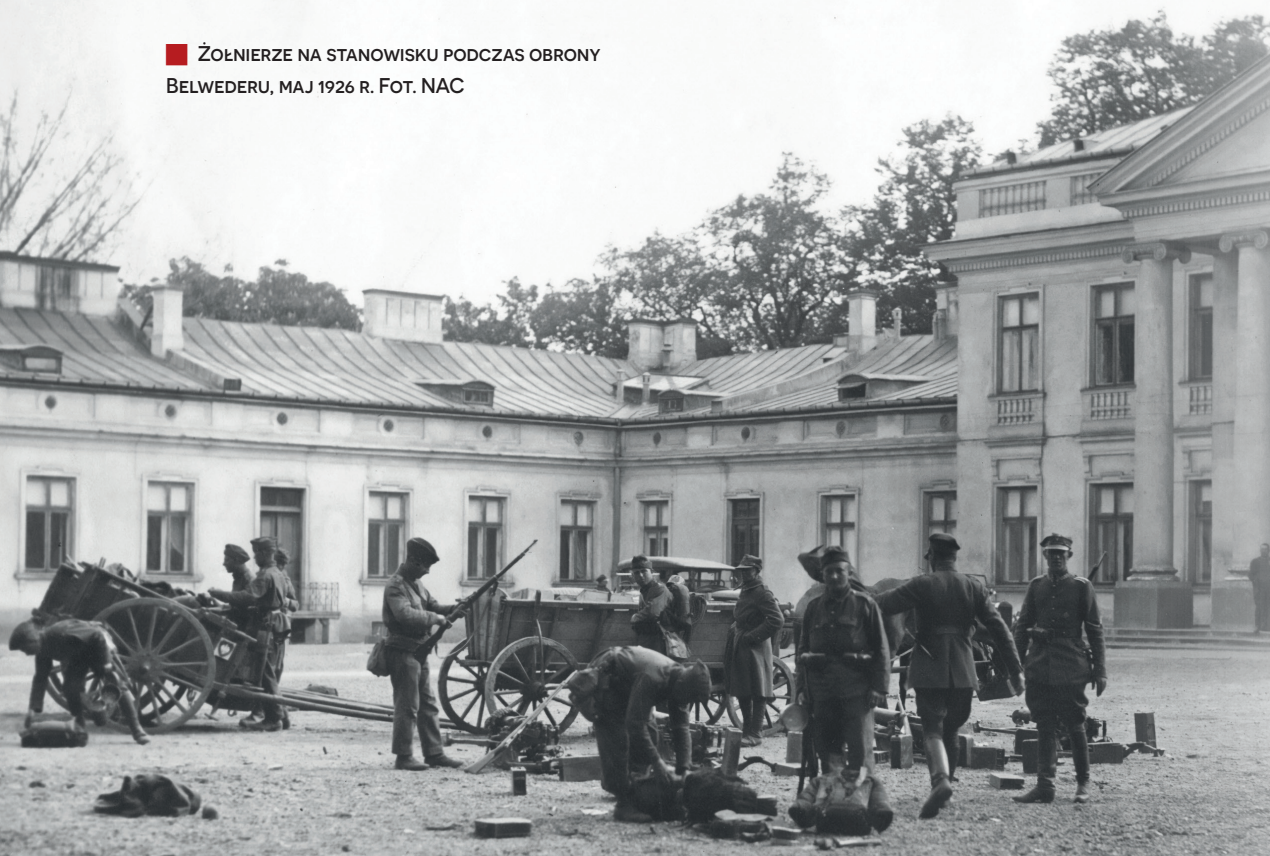
■ ŻOŁNIERZE NA STANOWISKU PODCZAS OBRONY BELWEDERU, MAJ 1926 R.

Historykom i publicystom, opisującym przebieg dni majowych, trudno zrozumieć całkowitą beztroskę organizatorów „zamachu”, a zwłaszcza brak koordynacji czy zupełne niewyzyskanie elementu zaskoczenia. Za bezsporny należy uznać fakt pełnej improwizacji podjętych przez Piłsudskiego działań, co wymownie świadczy o braku jakiegokolwiek „zamachowego” planu. Wszelako owo pozorne zaniedbanie