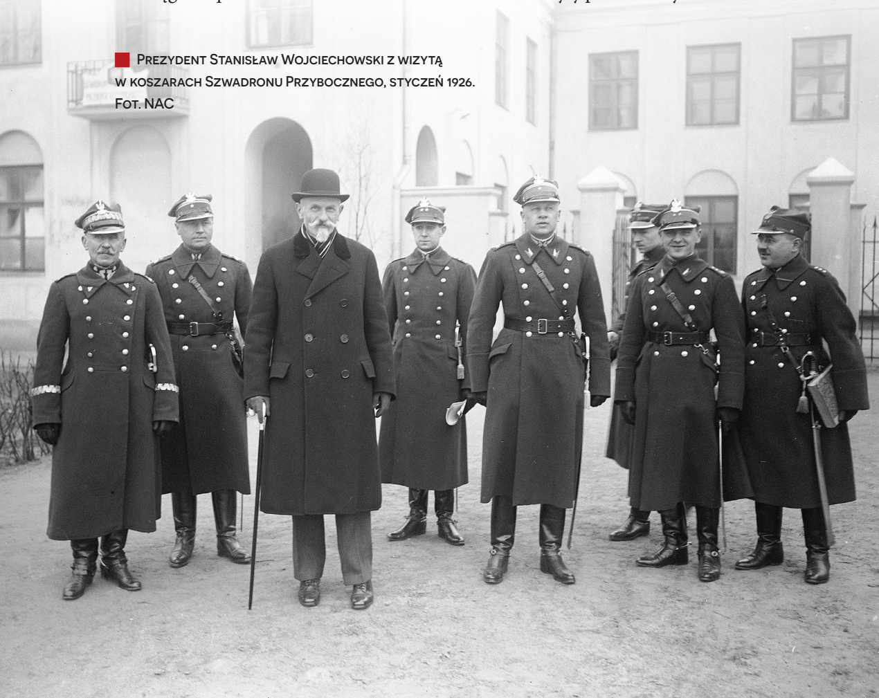
■ PREZYDENT STANISŁAW WOJCIECHOWSKI Z WIZYTĄ W KOSZARACH SZWADRONU PRZYBOCZNEGO, STYCZEŃ 1926.

Po rozpoczęciu walk z wojskowego punktu widzenia ich rozstrzygnięcie zależało od tego, kto w krótszym czasie zdoła uzyskać wystarczającą przewagę dla pokonania strony przeciwnej. Dowodzący po obu stronach generałowie (Dreszer z ramienia Piłsudskiego, Rozwadowski z nominacji prezydenta) skupili się na ściąganiu posiłków. Rezerwuarem dla sił Marszałka były przede wszystkim dwa