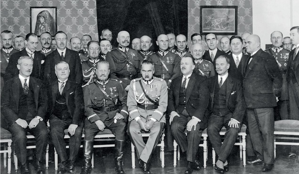
■ POŻEGNALNY BANKIET NA CZEŚĆ GEN. DYW. LUCJANA ŻELIGOWSKIEGO ODCHODZĄCEGO W STAN SPOCZYNKU, 27 PAŹDZIERNIKA 1927 R. W PIERWSZYM RZĘDZIE SIEDZĄ OD LEWEJ: MINISTER ROLNICTWA I DÓBR PAŃSTWOWYCH PAWEŁ ROMOCKI, MINISTER SKARBU GABRIEL CZECHOWICZ, GEN. DYW. LUCJAN ŻELIGOWSKI, MARSZ. JÓZEF PIŁSUDSKI, MINISTER BEZ TEKI KAZIMIERZ BARTEL, MINISTER ROLNICTWA I DÓBR PAŃSTWOWYCH KAROL NIEZABYTOWSKI.

znacznie dowodzi, że pierwsze decyzje podjęli wojskowi, dopiero w następnej kolejności aprobowali je politycy, a zgodził się z nimi i, co więcej, przekreślił możliwość kompromisu, prezydent.