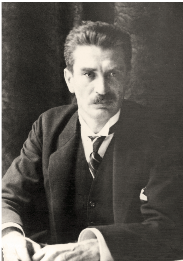
■ MARSZAŁEK SEJMU MACIEJ RATAJ.

DOK – III Grodno i II Lublin. Dla sił rządowych DOK VII Poznań (dowodził nim, po samobójczej próbie gen. Kazimierza Sosnkowskiego podjętej tuż przed południem 13 maja, gen. Edmund Hauser). Zawiódł Lwów – Sikorski swą pasywnością tłumaczył obawą o wystąpienia Ukraińców, choć głównym powodem była niechęć na walce z Marszałkiem postawa odkomenderowanych do wyjazdu do Warszawy oddziałów. Starano się ponadto przejąć kontrolę nad środkami łączności, a strona rządowa dodatkowo musiała przełamywać blokady czynione przez kolejarzy.