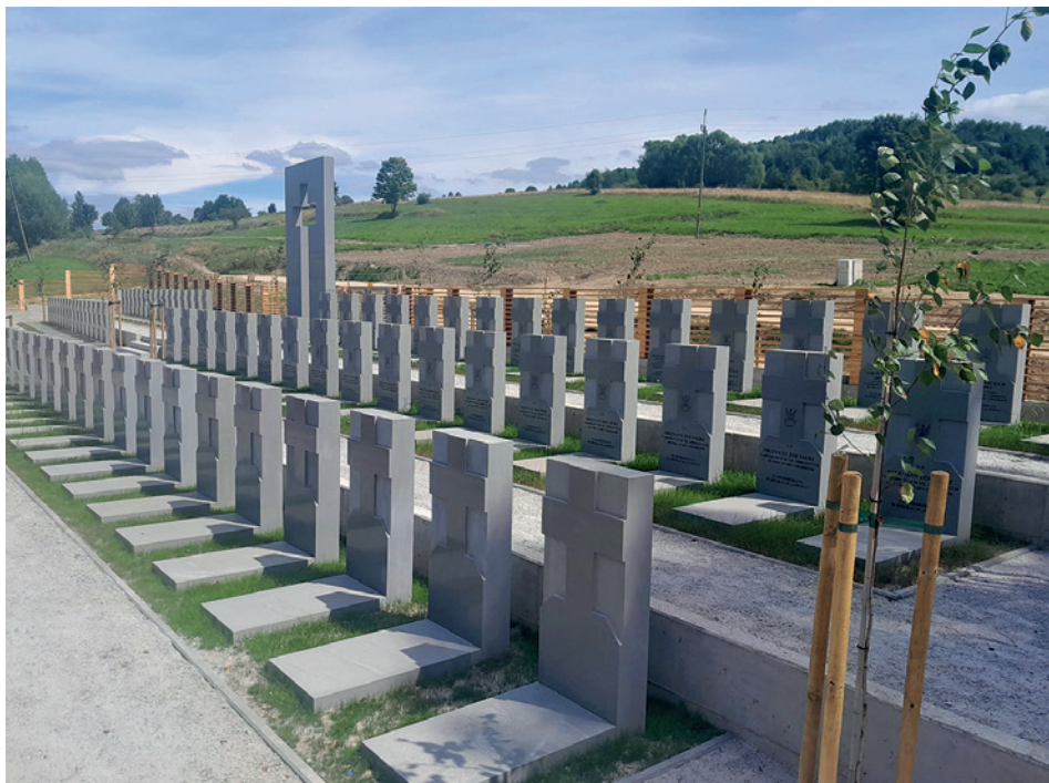
Widok na cmentarz w kierunku północnym, marzec 2026 r.