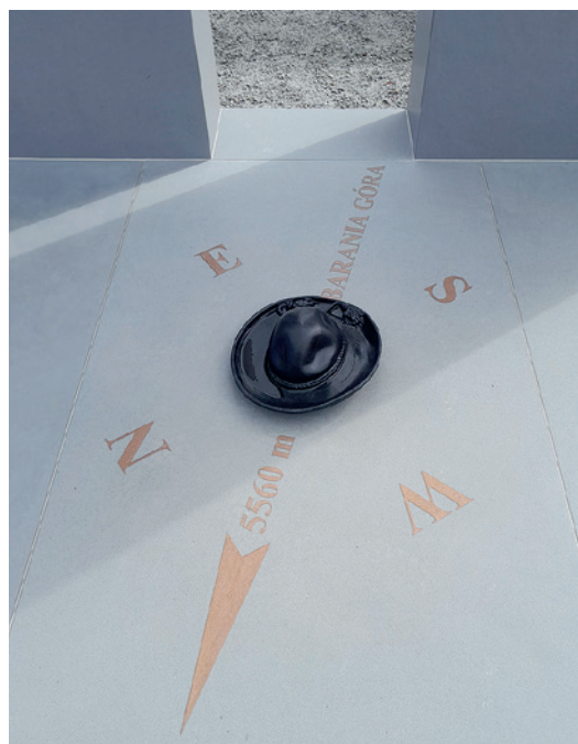
Róża wiatrów symbolicznie wskazująca Baranią Górę, na której stokach mieściły się obozy sztabu zgrupowania „Bartka”, oraz żywiecki kapelusz symbolizujący związki partyzantów z miejscową ludnością