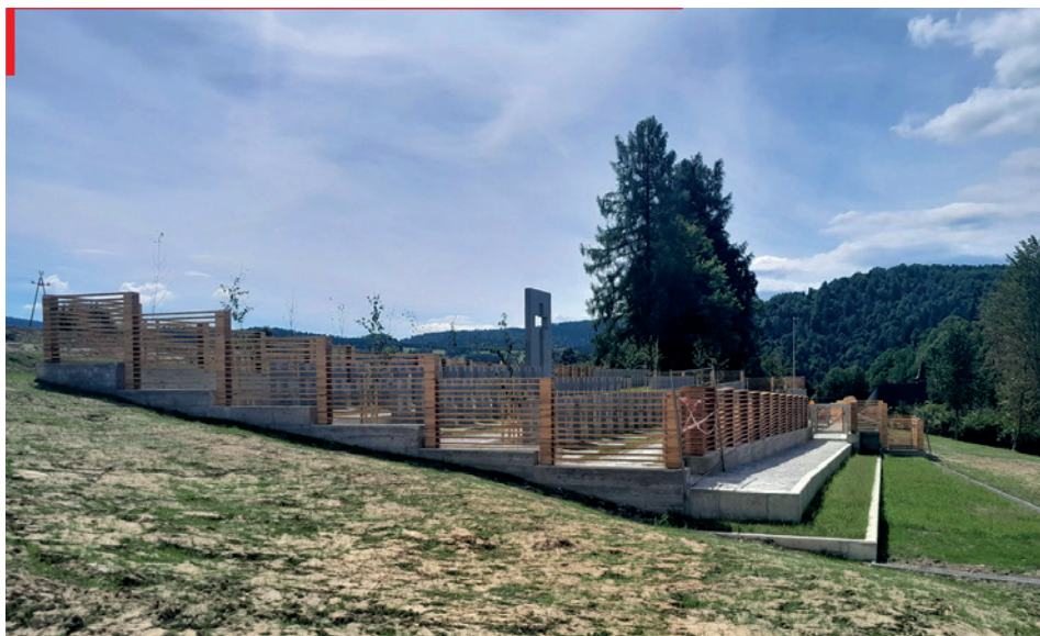
Widok na cmentarz w kierunku południowym, marzec 2026 r.