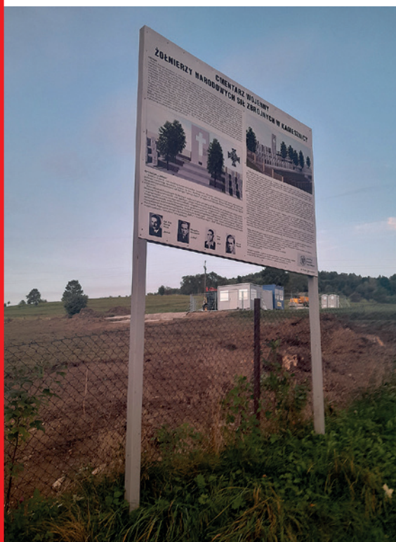
Rozpoczęcie budowy cmentarza, czerwiec 2024 r.