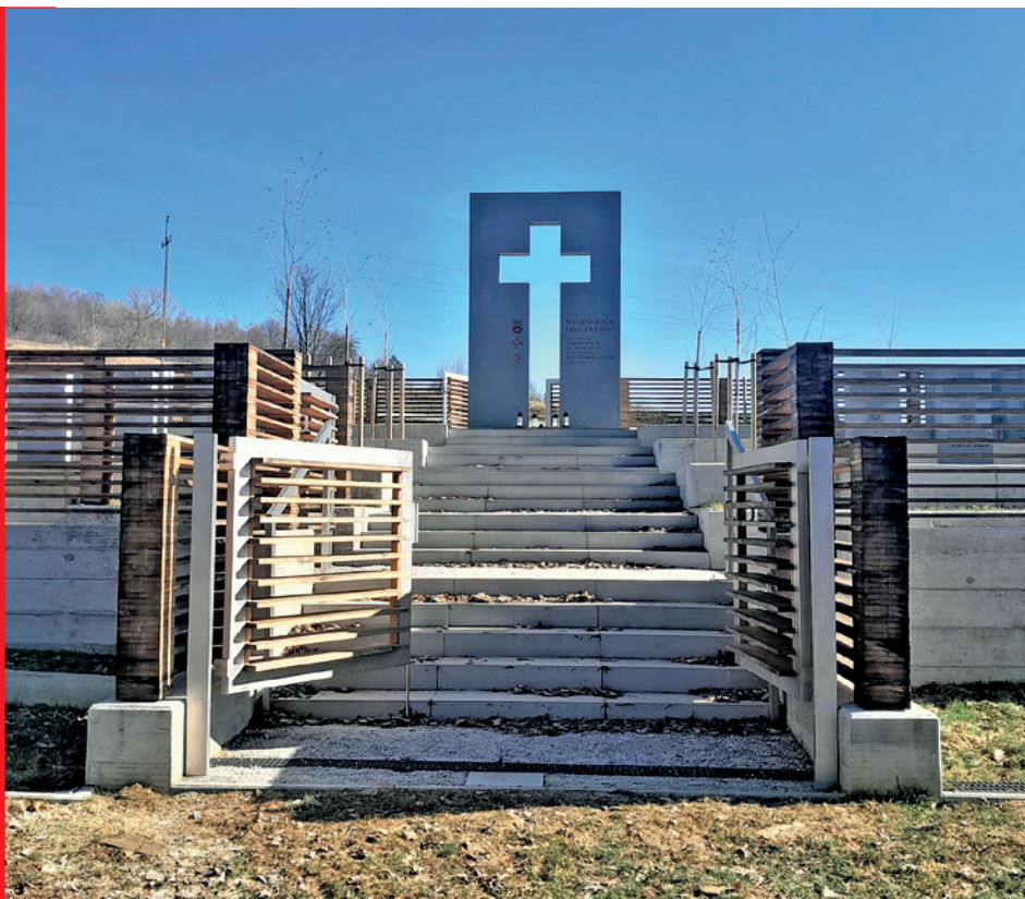
Główna oś cmentarza, schody prowadzące do pomnika, marzec 2026 r.