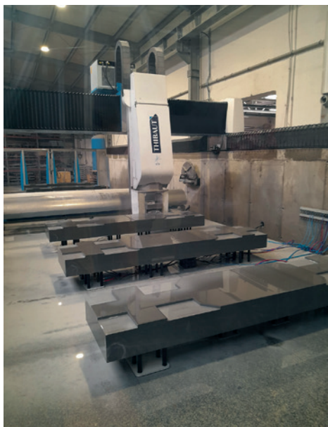
Wycinanie tablic nagrobnych w hali produkcyjnej Granity Skwara Group