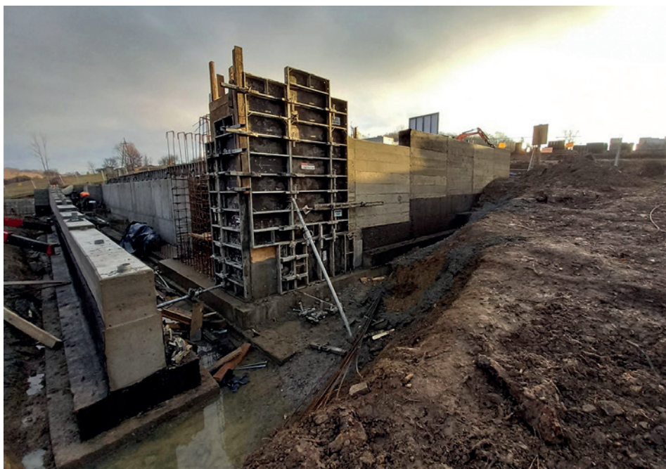
Produkcja elementów głównego pomnika