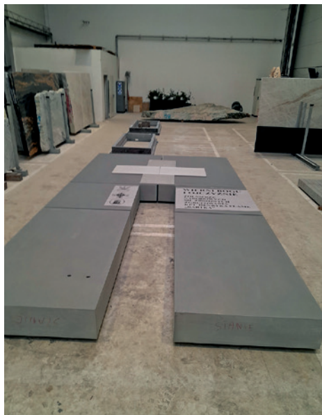
Produkcja elementów głównego pomnika