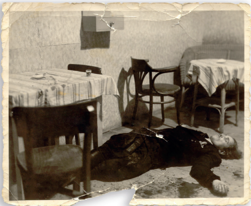
„Bartek” zastrzelony w restauracji w Zabrzegu

polskiego. Akcje likwidacyjne wobec UB i służb kierowanych przez komunistów pokazywały funkcjonariuszom aparatu represji, że nie są bezkarni nawet mimo ochrony sowieckiej i militarnej obecności ZSRS w Polsce. W gruncie rzeczy to był ostatni czas, kiedy funkcjonariusze bezpieki i ich współpracownicy, działający przeciw niepodległości państwa polskiego, bywali skutecznie pociągani do odpowiedzialności za aktywny udział w zbrodniach przeciw państwu i obywatelom.