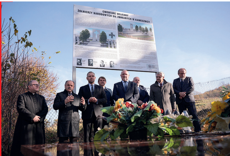
Prezentacja koncepcji cmentarza wojennego żołnierzy NSZ w Kamesznicy, 26 października 2022 r.