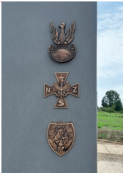
Symbole umieszczone na frontowej ścianie pomnika: orzeł Wojska Polskiego, Krzyż Narodowych Sił Zbrojnych oraz jeden z ryngrafów noszonych przez żołnierzy zgrupowania „Bartka”