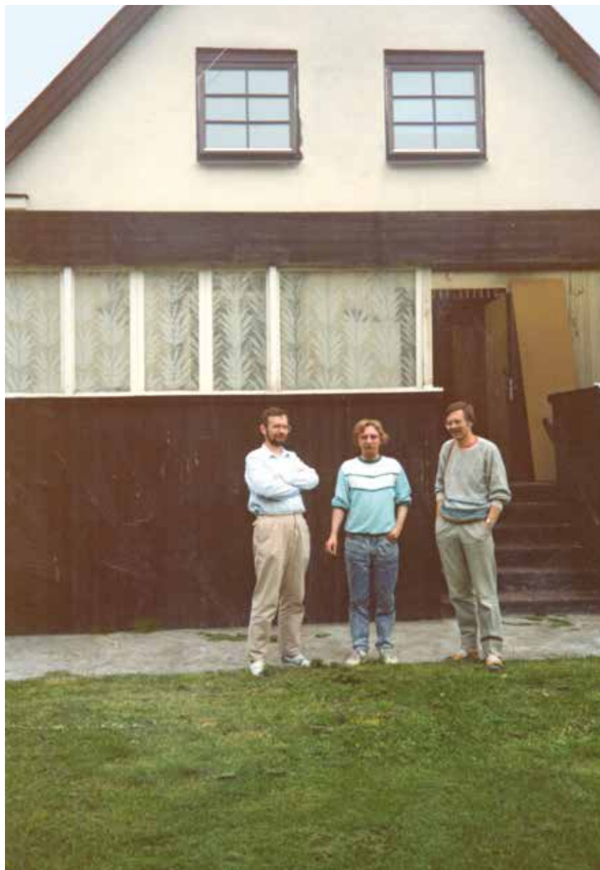
Autor (w środku) ze współpracownikami ze Sztokholmu, Malmö, 1986 r.