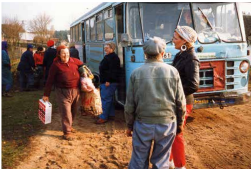
Pomoc charytatywna ze Szwecji dotarła do odbiorców