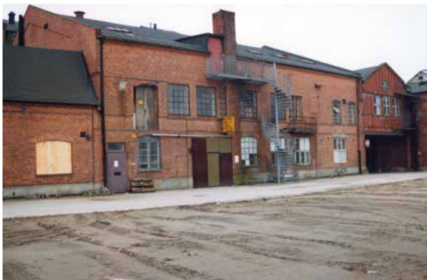
Nieczynna fabryka w Malmö (dziś już nieistniejąca), w której na piętrze znajdował się magazyn sprzętu poligraficznego szmuglowanego tirami ze Szwecji do Polski, druga połowa lat osiemdziesiątych. Widok od strony podwórka