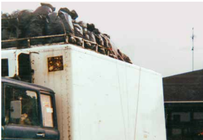
Mercedes, w którym w specjalnej skrytce przemycano maszyny drukarskie dla podziemia solidarnościowego w latach 1982–1985