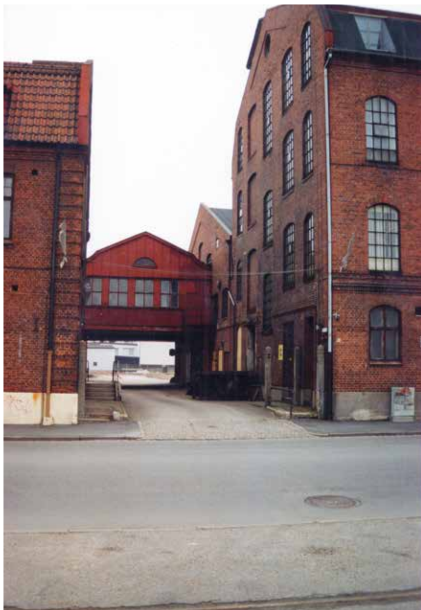
Wjazd na podwórko