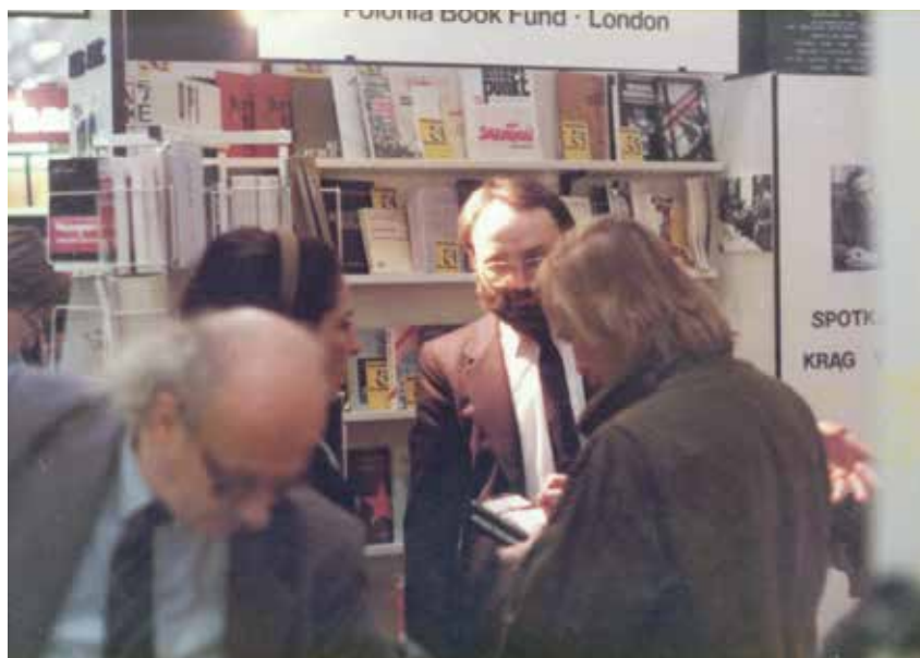
Polskie stoisko na targach cieszyło się wielkim zainteresowaniem