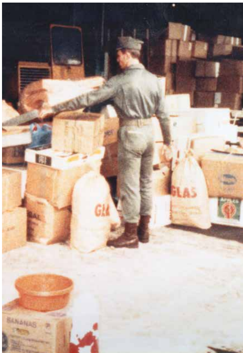
Celnicy kontrolują zawartość transportu, Gdańsk, 1983 r.