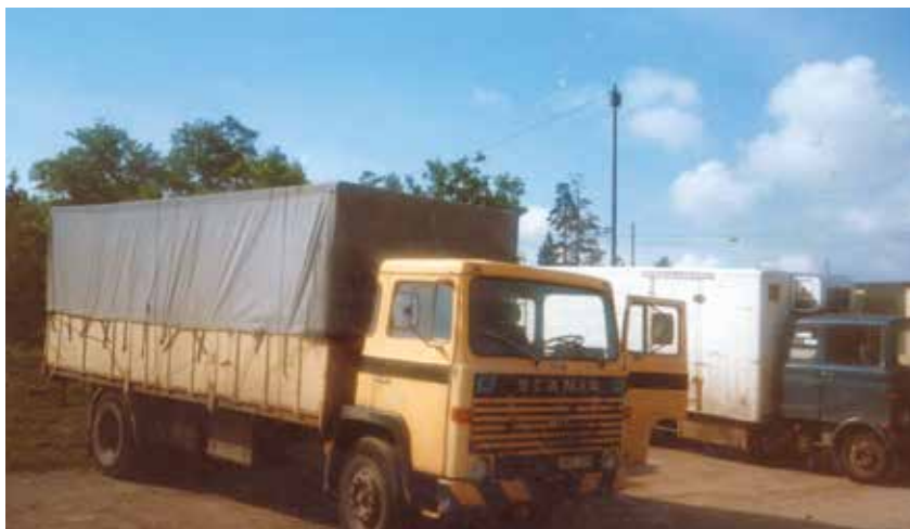
Jeden z transportów z pomocą charytatywną, tym razem dwiema ciężarówkami – scanią i mercedesem, pierwsza połowa lat osiemdziesiątych