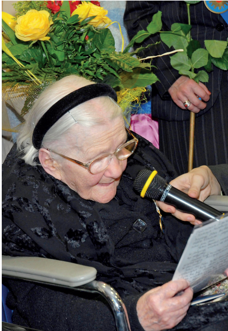
אירנה סנדלר מקבלת את "אות החיוך" לשנת 2007

החלטה על כיבוד אירנה סנדלר והמועצה לעזרת יהודים "ז'גוטה". ב-27 בינואר 2007 לציון יום הזיכרון הבינלאומי לקורבנות השואה אירנה סנדלר אמרה: "הייתי רוצה שישתמר הזיכרון על אנשים אצילים רבים שבסיכון חייהם הצילו את אחיהם היהודים, והיום איש כבר אינו זוכר את שמם... חלומי שהזיכרון יהפוך לאזהרה לעולם כולו. שלא תשוב עוד לעולם דרמה דומה לאנושות."