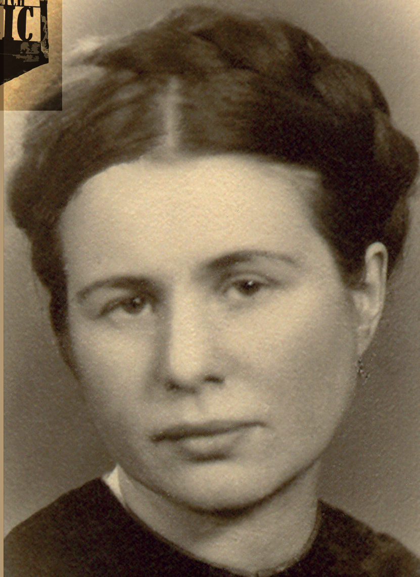
אירנה סנדלר (1910–2008)