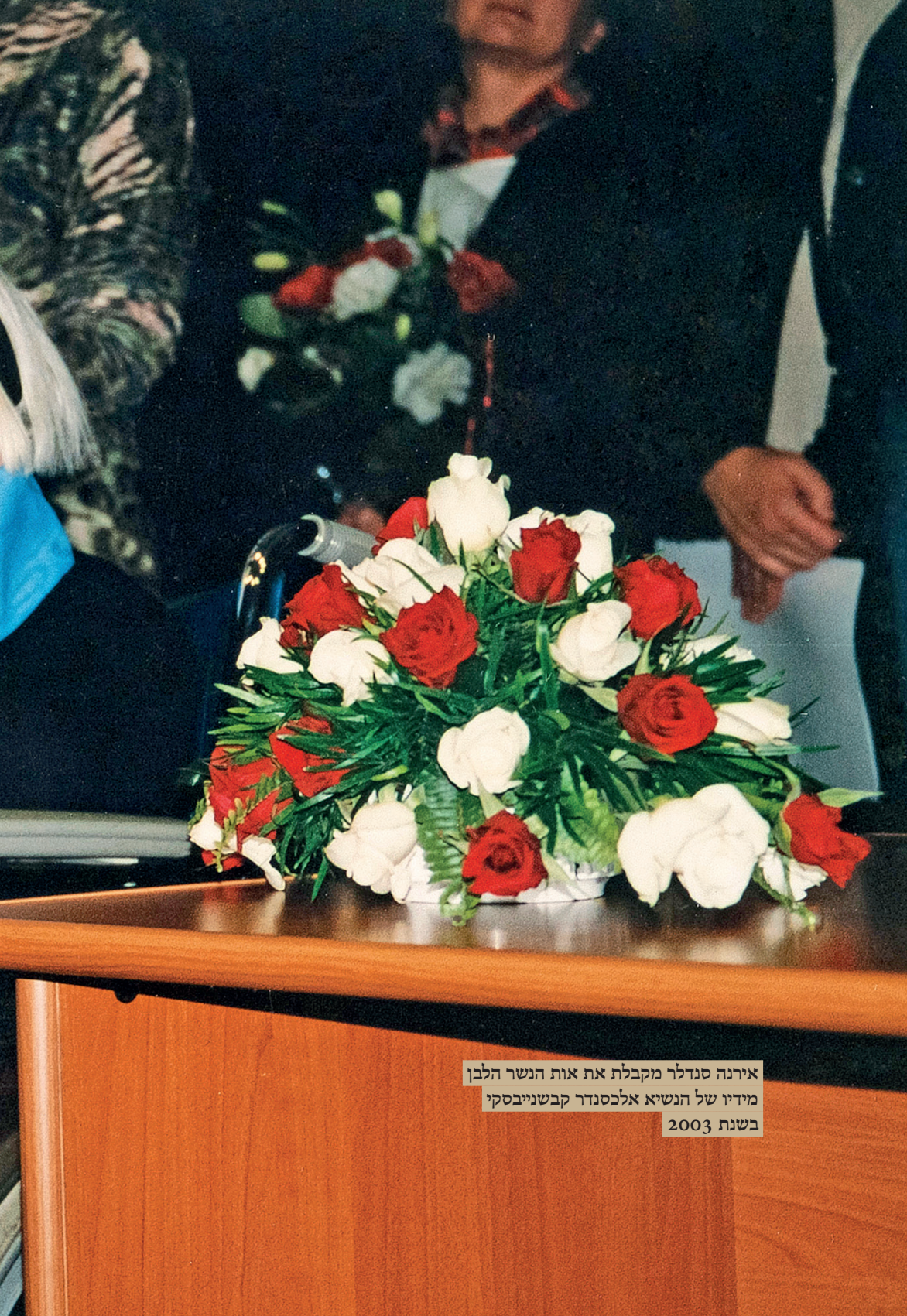
אירנה סנדלר מקבלת את אות הנשר הלבן מידיו של הנשיא אלכסנדר קבשנייבסקי בשנת 2003