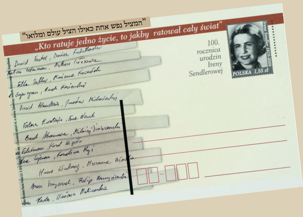
גלויית דואר עם דיוקנה של אירנה סנדלר