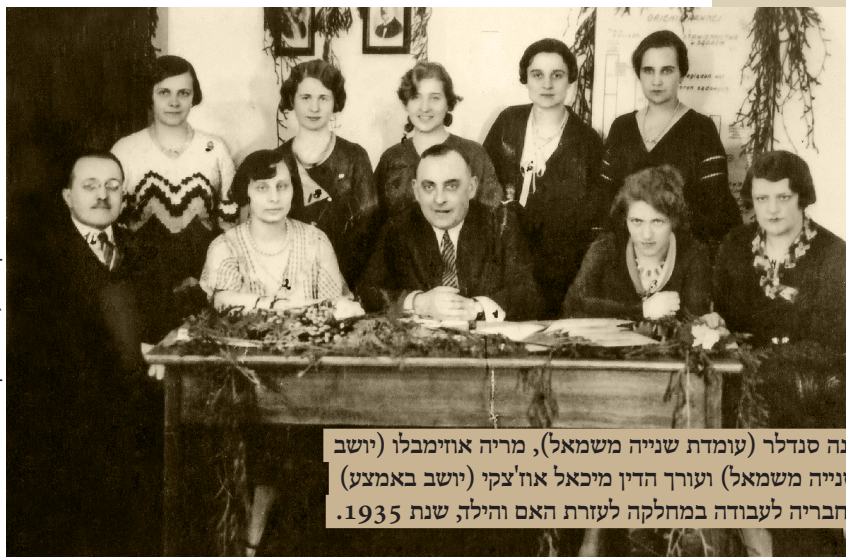
אירנה סנדלר (עומדת שנייה משמאל), מריה אוזימבלו (יושבת שנייה משמאל) ועורך הדין מיכאל אוז'צקי (יושב באמצע) עם חבריה לעבודה במחלקה לעזרת האם והילד, שנת 1935.

אירנה סנדלר למדה שם בגימנסיה ע"ש הלנה טשצ'ינסקה והצטרפה לגדוד צופים. בתקופה זו גם הכירה את בעלה לעתיד מייצ'סלב סנדלר. בשנת 1929 לאחר שעברה בחינות בגרות עברה לוורשה והחלה את לימודיה בפקולטה למשפטים של אוניברסיטת וורשה, למרות שלפני כן חשבה על לימודים בפריז. לאחר שנתיים עברה לפקולטה של מדעי הרוח. זמן קצר לאחר מכן הושעתה מהאוניברסיטה למספר שנים בגלל פעילות פוליטית. הסיבה לכך הייתה הזדהותה עם הסטודנטים היהודים שהופלו לרעה במסגרת חוק "נומרוס קלאוזוס" שהגביל את אחוז הסטודנטים היהודים במוסדות להשכלה גבוהה בפולין. בפועל בתעודת הסטודנט הופיעה הערה "צד שמאל עבור יהודים", "צד ימין, הארי, עבור פולנים". אירנה מחקה בתעודתה את הכתובת "הצד הארי". היא חידשה את לימודיה רק בשנת 1938/39. היא כתבה עבודת מאסטר על יצירותיה של אליזה אוז'שקובה בהנחיתו של פרופסור ואצלב בורובי, אך לא הגנה על התואר בגלל פרוץ המלחמה. בשנת 1931 היא נישאה למייצ'סלב סנדלר, שהיה פילולוג קלאסי בהשכלתו. כעבור שנה התחילה לעבוד במחלקה המשפטית בסניף לעזרת האימהות והילד בוועד האזרחי לעזרה סוציאלית. היא טיפלה בנשים שהוצאו מדירותיהן בגלל שלא שילמו שכר דירה, שלא קיבלו מזונות ובמיוחד בילדים שנולדו מחוץ לנשואין.