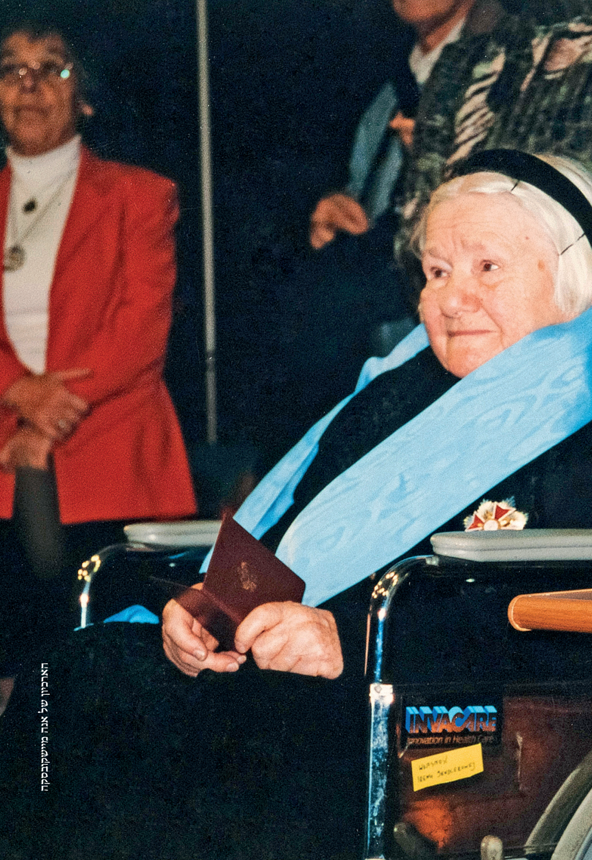
הארכיון של אנה מיישקובסקה