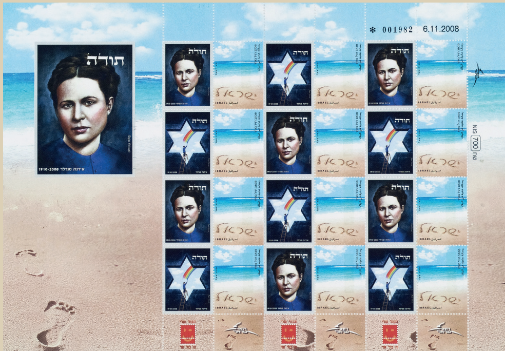
בולי דואר ישראלים עם הדיוקן של אירנה סנדלר