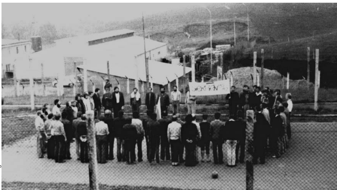
Internowani uczcili drugą rocznicę podpisania porozumień sierpniowych

dostępne w więzieniu materiały, tworzyli tzw. fajanse, czyli różnego rodzaju obrazy, rzeźby (głównie o charakterze patriotycznym i religijnym). Często organizowano protesty, w tym również głodowe. Żądano zniesienia stanu wojennego i wypuszczenia więźniów politycznych, ale również walczone o bardziej doraźne sprawy, chociażby umożliwienie posługi religijnej, widzeń z bliskimi, opieki lekarskiej nad chorymi współwięźniami 9 .