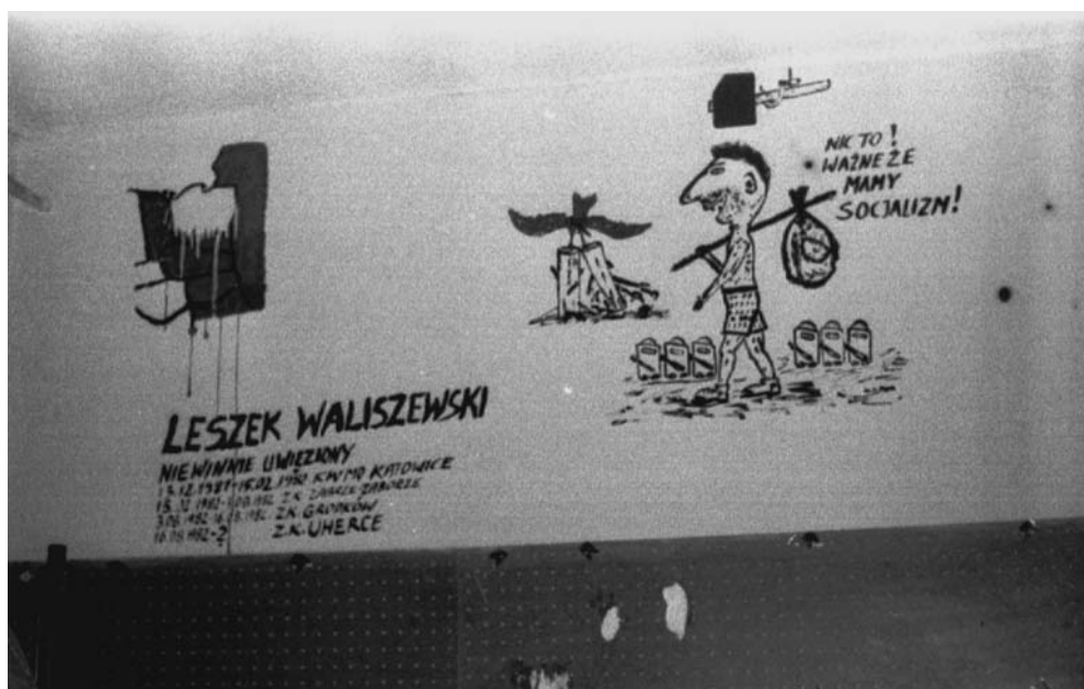
Cela Leszka Waliszewskiego

nie pozwolono zabrać żadnych leków [...]. Noce spędzaliśmy w celach, w których temperatura nie przekraczała 7 stopni, śpiąc w ubraniach pod dwoma kocami [...] na nasze żądanie ludzkiego traktowania zorganizowano demonstrację siły” 7 . Ta grupa i tak mogła mówić o szczęściu. W marcu 1982 r. w ośrodku odosobnienia w Iławie internowani domagający się przestrzegania przysługujących im praw zostali przez strażników pobici. Wcześniej, 13 lutego 1982 r., podobny los spotkał grupę około 40 osób w ośrodku odosobnienia w Wierchowie Pomorskim. Za zdemontowanie podsłuchów w celach urządzono im regularne „ścieżki zdrowia”. W sierpniu 1982 r. w Kwidzynie brutalnie pobito kilkudziesięciu internowanych domagających się widzeń z rodzinami, część z nich przypląciła to trwałym kalectwem 8 .