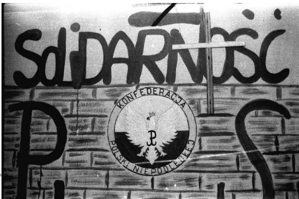
Rysunek w celi członka KPN