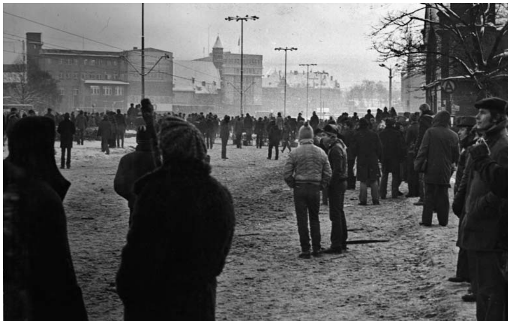
Demonstranci przed Dworcem Głównym w Gdańsku, 16 lub 17 grudnia 1981 r., biały budynek w głębi to Komitet Wojewódzki PZPR