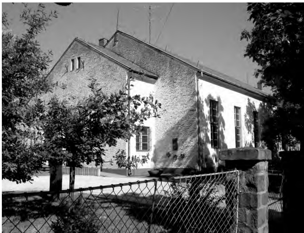
Polska szkoła w Balatonboglár