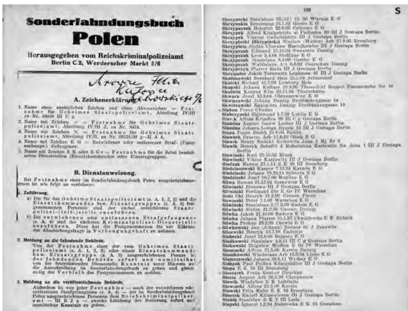
Specjalna Księga Gończa dla Polski ( Sonderfahndungsbuch Polen ), ze zbiorów AIPN w Katowicach

Za zdecydowane opowiedzenie się za Polską, działalność w okresie powstań śląskich i plebiscytu, aktywność w ruchu socjalistycznym Sławik nie mógł liczyć – z czego doskonale sobie zdawał sprawę – na litość nazistowskiego aparatu represji. Jego nazwisko znalazło się w przygotowanej przez hitlerowców Sonderfahndungsbuch Polen , czyli Specjalnej Księdze Gończej zawierającej listę osób, które z różnych powodów – przede wszystkim ze względu na swą działalność o charakterze społecznym, politycznym lub też określoną postawę – wzbudziły zainteresowanie niemieckich służb policyjnych. Sławik wziął aktywny udział w przygotowaniach do obrony, jednak z powodu błyskawicznego postępu wojsk niemieckich w pierwszych dniach września opuścił Górną Śląsk, a następnie w drugiej połowie miesiąca przekroczył – jak się okazało, już na zawsze – granicę kraju.