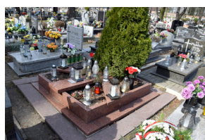
IPN Katowice oddał hołd śp. mjr. Czesławowi Blicharskiemu w 9. rocznicę jego śmierci – Zabrze-Biskupice, 21 marca 2024