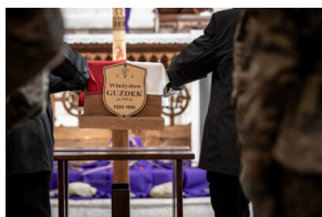
Pogrzeb śp. Władysława Guzdkę ps. „Wilk” – Czechowice-Dziedzice, 21 marca 2024.