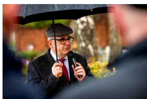
Instytut Pamięci Narodowej oddał hołd rodzinie Zimoniów z Rybnika - Rybnik, 25 marca 2024.