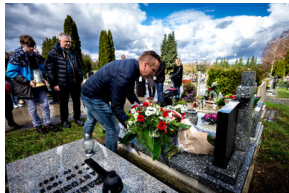
Instytut Pamięci Narodowej oddał hołd rodzinie Zimoniów z Rybnika - Rybnik, 25 marca 2024.