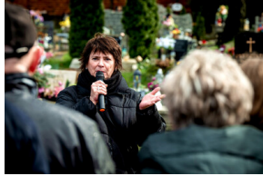
Instytut Pamięci Narodowej oddał hołd rodzinie Zimoniów z Rybnika - Rybnik, 25 marca 2024.