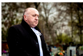
Instytut Pamięci Narodowej oddał hołd rodzinie Zimoniów z Rybnika - Rybnik, 25 marca 2024.