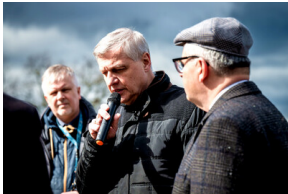
Instytut Pamięci Narodowej oddał hołd rodzinie Zimoniów z Rybnika - Rybnik, 25 marca 2024.