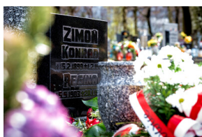
Instytut Pamięci Narodowej oddał hołd rodzinie Zimoniów z Rybnika - Rybnik, 25 marca 2024.