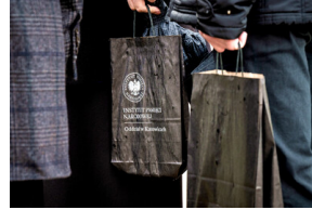
Instytut Pamięci Narodowej oddał hołd rodzinie Zimoniów z Rybnika - Rybnik, 25 marca 2024.