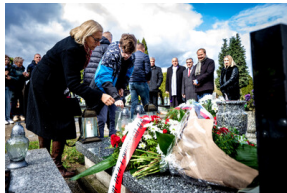
Instytut Pamięci Narodowej oddał hołd rodzinie Zimoniów z Rybnika - Rybnik, 25 marca 2024.