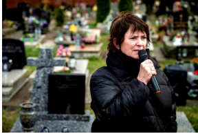
Instytut Pamięci Narodowej oddał hołd rodzinie Zimoniów z Rybnika - Rybnik, 25 marca 2024.