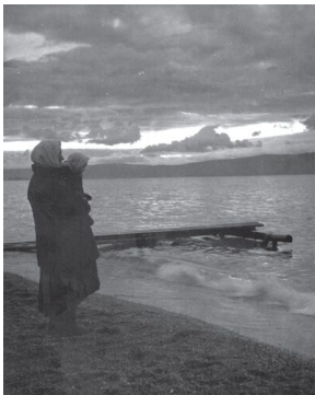
Matka i córka. Wyspa Oichon na jeziorze Bajkał, 1934 r.