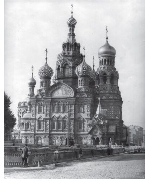
Sobór Zmartwychwstania Pańskiego. Zamknięty w latach 1930-1997. Leningrad, lata trzydzieste XX w.