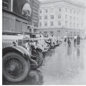
Samochody uczestników VII Wszechświatowego Kongresu Kominternu zaparkowane przed domem Związków u zbiegu ulicy Ocnotnyj riad i Bolszaja Dmitrowka. Moskwa, sierpień 1935 r.