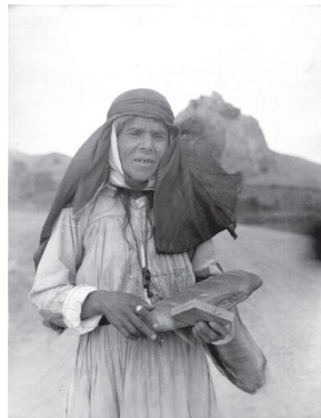
Kobieta z wioski Gebi w Gruzji, 1933 r.