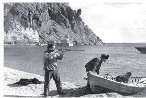
Bajkał, 1934 r.