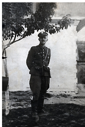
Hieronim Dekutowski „Zapora”

► Czytaj całość na portalu przystanekhistoria.pl