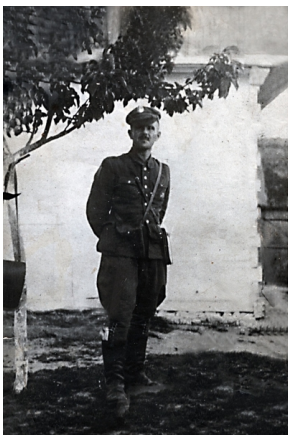
Hieronim Dekutowski „Zapora”

► Czytaj całość na portalu przystanekhistoria.pl