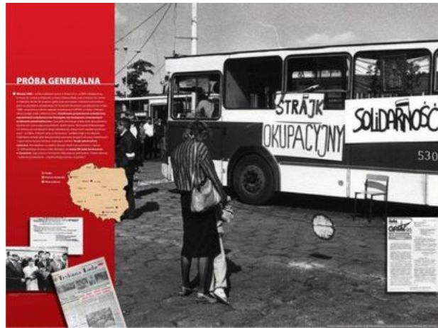
zdjęcie nr 7