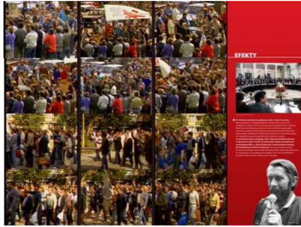
zajęcie nr 19