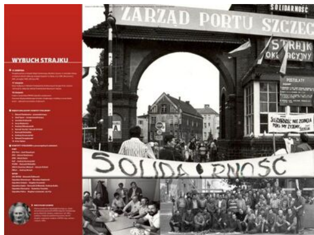
zdjęcie nr 8