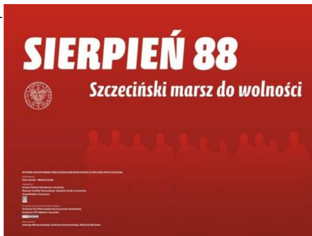
zdjęcie nr 1

Przy tworzeniu wystawy wykorzystano prywatne zbiory Andrzeja Milczanowskiego, Kazimierza Nowotarskiego, Wojciecha Woźniaka. Skorzystano także z materiałów