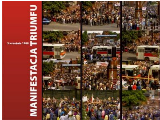
zajęcie nr 16