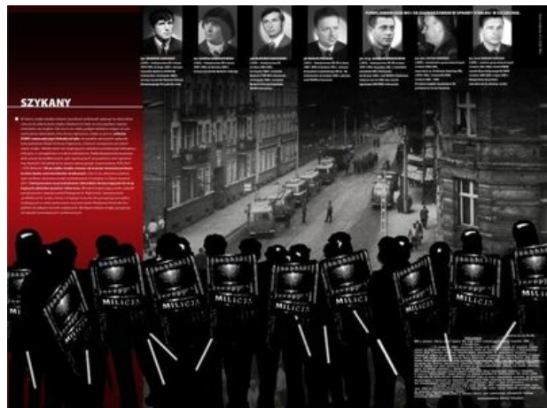
zajęcie nr 11