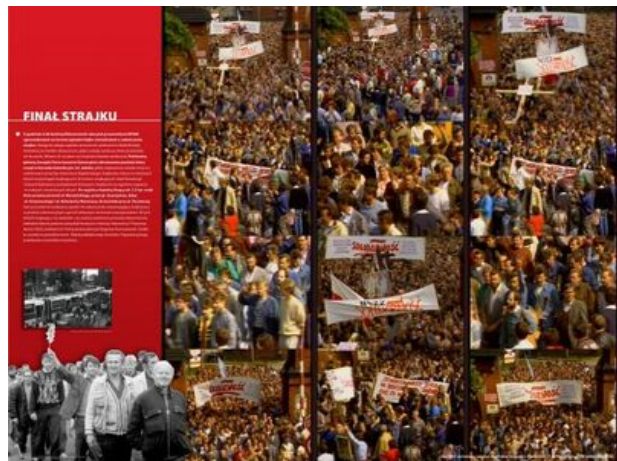
zajęcie nr 17