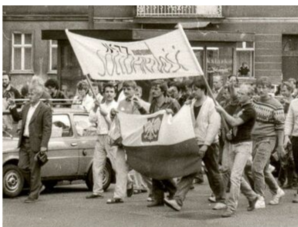
zdjęcie nr 5