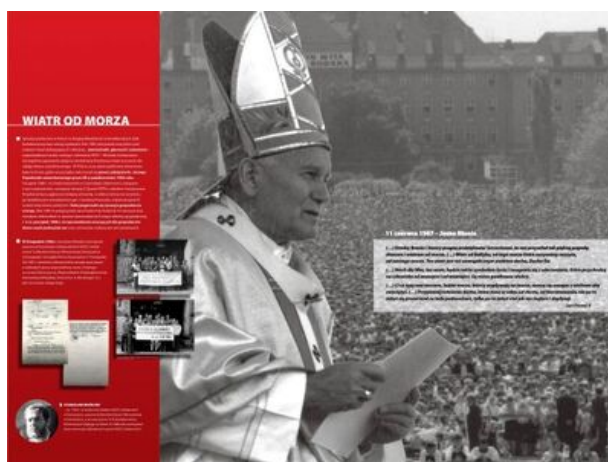
zdjęcie nr 6