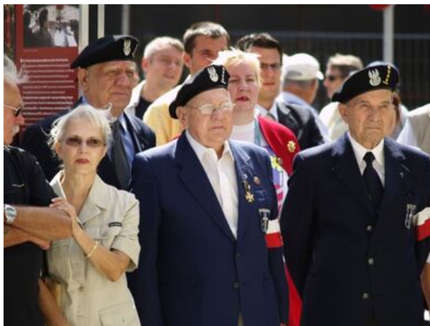
zdjęcie nr 4