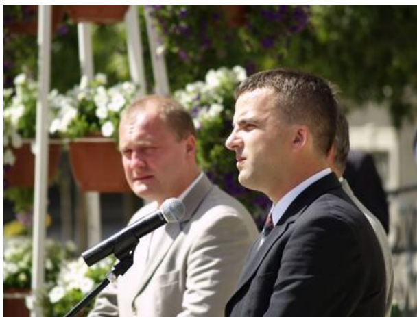
zdjęcie nr 3