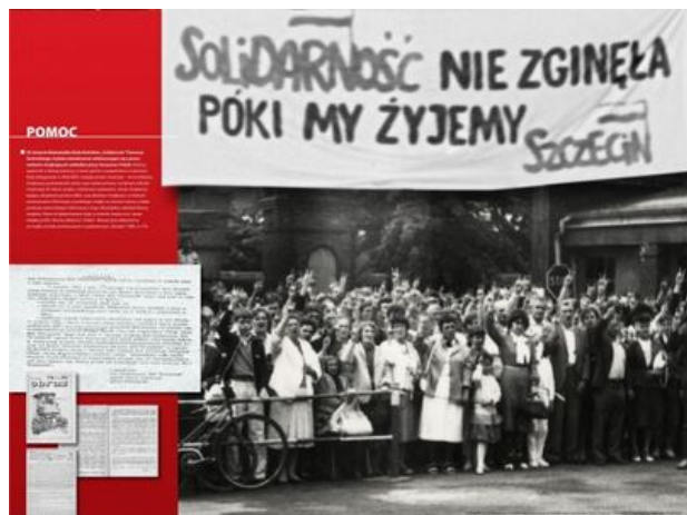
zdjęcie nr 9