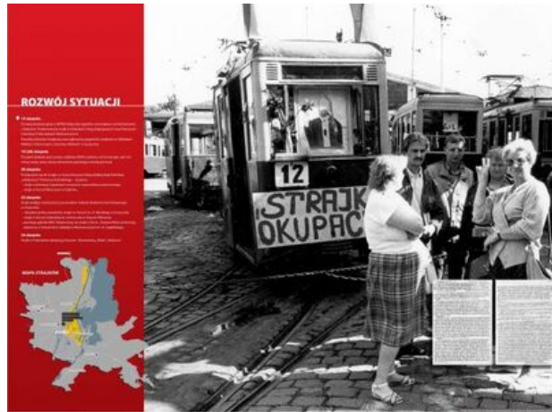
zajęcie nr 10