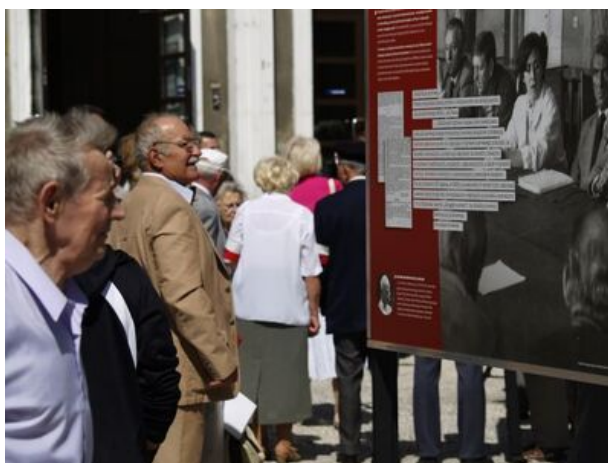
zdjęcie nr 2