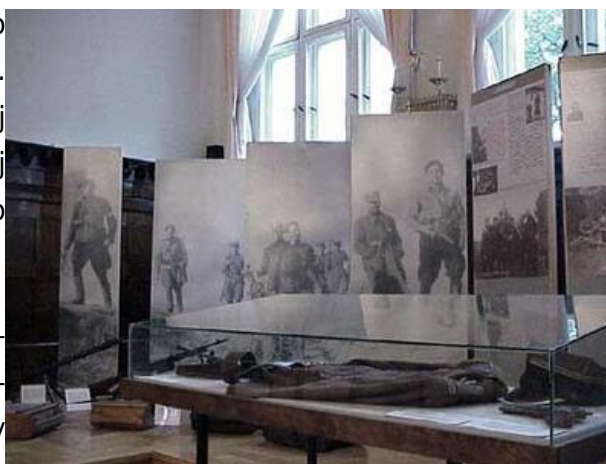
Fragment wystawy „Za świętą Sprawę” podczas jej prezentacji w sali obrad Rady Miejskiej Sopotu