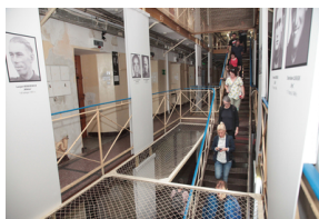
Uczestnicy projektu odwiedzili Muzeum Żołnierzy Wyklętych i Więźniów Politycznych PRL - 23 lipca 2019.