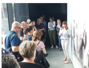
Objazd edukacyjny zagranicznych edukatorów w ramach szkolenia „Poland in the Heart of European History” – 20 lipca 2019