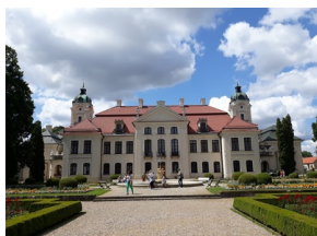
Objazd edukacyjny zagranicznych edukatorów w ramach szkolenia „Poland in the Heart of European History” - 18-22 lipca 2019

Kolejnym miejscem, które odwiedzili nauczyciele z całego świata był niemiecki obóz koncentracyjny Majdanek. Według planów miał być to największy obóz koncentracyjny w Europie. Budowy w całości nie ukończono, a plan zrealizowano jedynie w 1/5. Komory gazowe obozu działały do września 1943 r. Ponieważ front się załamał i Niemcy zaczęli szybko się wycofywać na linię Wisły zdecydowano o masowym rozstrzelaniu więźniów. Tylko 3 listopada 1943 roku w tzw. „krwawą środę”, podczas akcji Erntefest („Dożynki”) w jednym dniu rozstrzelano w pobliskim lesie ok. 18 000 ludzi.