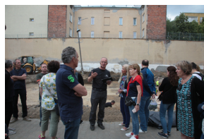
O pracach poszukiwawczych na Rakowieckiej opowiedział