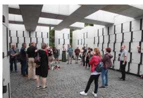
Spacer po Cmentarzu Wojskowym na Powązkach w Warszawie – 23 lipca 2019.