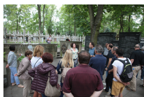
Spacer po Cmentarzu Wojskowym na Powązkach w Warszawie – 23 lipca 2019.

Podczas spaceru po Cmentarzu Wojskowym na Powązkach oddano hołd uczestnikom Powstania Warszawskiego, ofiarom zbrodni katyńskiej oraz Żołnierzom Niezłomnym pochowanym w kwaterze „Ł”. Dokładnie 23 lipca 2012 r., siedem lat temu, zespół prof. Krzysztofa Szwańczyka rozpoczął prace na „Łączce”. W tę wyjątkową rocznicę na Powązkach zagraniczni nauczyciele zakończyli swoją ostatnią wizytę w Warszawie.