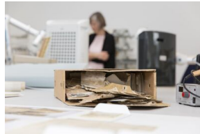
Uczestnicy seminarium „Poland in the Heart of European History” z wizytą w Archiwum IPN - 23 lipca 2019.