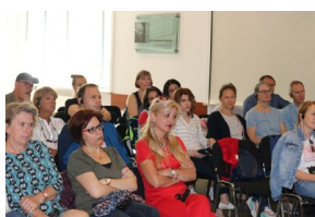
Otwarcie seminarium z historii Polski XX wieku dla nauczycieli i edukatorów „Poland in the Heart of European History” – Warszawa, 15 lipca 2019