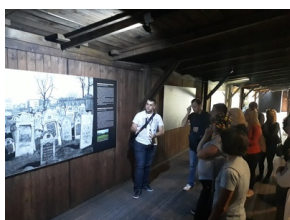
Objazd edukacyjny zagranicznych edukatorów w ramach szkolenia „Poland in the Heart of European History” - 18-22 lipca 2019