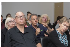
Uczestnicy seminarium „Poland in the Heart of European History” z wizytą w Archiwum IPN – 23 lipca 2019.