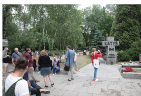
Spacer po Cmentarzu Wojskowym na Powązkach w Warszawie – 23 lipca 2019.