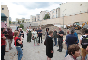
O pracach poszukiwawczych na Rakowieckiej opowiedział