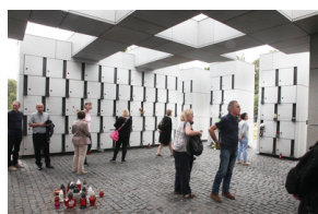
Spacer po Cmentarzu Wojskowym na Powązkach w Warszawie – 23 lipca 2019.