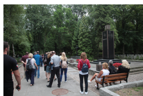
Spacer po Cmentarzu Wojskowym na Powązkach w Warszawie – 23 lipca 2019.