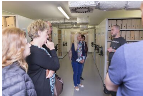
Uczestnicy seminarium „Poland in the Heart of European History” z wizytą w Archiwum IPN - 23 lipca 2019.