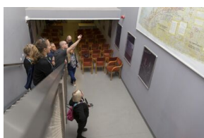
Uczestnicy seminarium „Poland in the Heart of European History” z wizytą w Archiwum IPN – 23 lipca 2019.