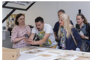
Uczestnicy seminarium „Poland in the Heart of European History” z wizytą w Archiwum IPN - 23 lipca 2019.