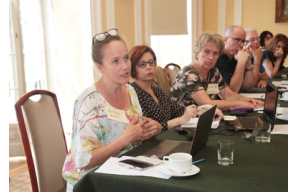
Wykład prof. Krzysztofa Szwagrzyka, wiceprezesa IPN – 23 lipca 2019.