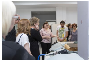
Uczestnicy seminarium „Poland in the Heart of European History” z wizytą w Archiwum IPN - 23 lipca 2019.