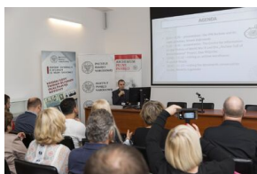
Uczestnicy seminarium „Poland in the Heart of European History” z wizytą w Archiwum IPN – 23 lipca 2019.

23 lipca 2019 roku grupa nauczycieli i edukatorów z zagranicy, goszcząca w Instytucie Pamięci Narodowej na konferencji edukacyjnej „Poland in the Heart of European History”, odwiedziła Archiwum IPN. Goście zapoznali się z zadaniami realizowanymi przez Archiwum IPN oraz dokumentami dotyczącymi ofiar II wojny światowej. Ponadto odwiedzili pracownię konserwacji i magazyn archiwalny, gdzie poznali podstawowe zasady przechowywania, zabezpieczania i konserwacji archiwaliów.