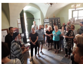
Objazd edukacyjny zagranicznych edukatorów w ramach szkolenia „Poland in the Heart of European History” – 20 lipca 2019

23 lipca 2019 roku grupa nauczycieli i edukatorów z zagranicy, goszcząca w Instytucie Pamięci Narodowej na konferencji edukacyjnej „Poland in the Heart of European History”, odwiedziła Archiwum IPN. Goście zapoznali się z zadaniami realizowanymi przez Archiwum IPN oraz dokumentami dotyczącymi ofiar II wojny światowej. Ponadto odwiedzili pracownię konserwacji i magazyn archiwalny, gdzie poznali podstawowe zasady przechowywania, zabezpieczania i konserwacji archiwaliów.