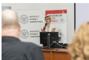
Uczestnicy seminarium „Poland in the Heart of European History” z wizytą w Archiwum IPN – 23 lipca 2019.