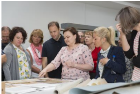
Uczestnicy seminarium „Poland in the Heart of European History” z wizytą w Archiwum IPN - 23 lipca 2019.