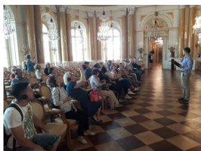
Warsztaty dla nauczycieli i edukatorów podczas seminarium „Poland in the Heart of European History”, Zamek Królewski w Warszawie - 15 lipca 2019

W Warszawie edukatorzy zobaczyli Zamek Królewski oraz poznali historię jego odbudowy, Muzeum Narodowe, Muzeum Historii Żydów Polskich POLIN oraz w kolejnych dniach Muzeum Żołnierzy Wyklętych i Więźniów Politycznych na ul. Rakowieckiej, Archiwum IPN, a także Cmentarz Wojskowy na Powązkach.