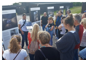
Objazd edukacyjny zagranicznych edukatorów w ramach szkolenia „Poland in the Heart of European History” - 18-22 lipca 2019