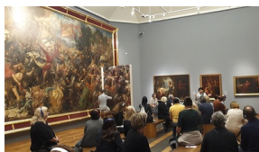
Warsztaty dla nauczycieli i edukatorów podczas seminarium „Poland in the Heart of European History” w Muzeum Narodowym w Warszawie - 17 lipca 2019

Od 18 do 22 lipca 2019 w ramach konferencji zagranicznych edukatorów „Poland in The Heart of European History” jej uczestnicy wyjechali w objazd edukacyjny po Lubelszczyźnie i Podkarpaciu. Pierwszym przystankiem było Muzeum Zamojskich w Kozłówce. Pałac zbudowany został w latach 1736-1742, ale swój największy okres świetności przeżywał za czasów Konstantego Zamoyskiego, który w 1903 r. założył tu ordynację. W 1928 w ogrodach okalających pałac znajdował się obóz szkoleniowy polskiej reprezentacji gimnastycznej na Letnie Igrzyska Olimpijskie w Amsterdamie, który zorganizował właściciel