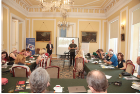
Wykład prof. Krzysztofa Szwagrzyka, wiceprezesa IPN – 23 lipca 2019.