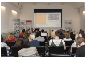
Uczestnicy seminarium „Poland in the Heart of European History” z wizytą w Archiwum IPN – 23 lipca 2019.