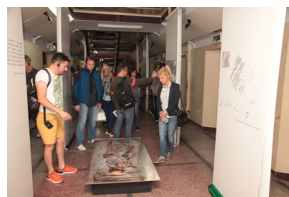
Uczestnicy projektu odwiedzili Muzeum Żołnierzy Wyklętych i Więźniów Politycznych PRL - 23 lipca 2019.