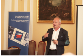
Wykład prof. Krzysztofa Szwagrzyka, wiceprezesa IPN – 23 lipca 2019.