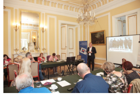
Wykład prof. Krzysztofa Szwagrzyka, wiceprezesa IPN – 23 lipca 2019.