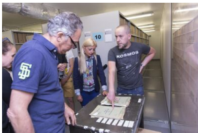
Uczestnicy seminarium „Poland in the Heart of European History” z wizytą w Archiwum IPN - 23 lipca 2019.