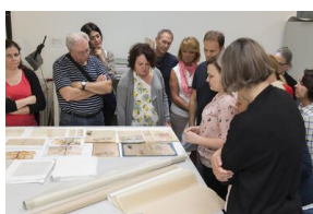
Uczestnicy seminarium „Poland in the Heart of European History” z wizytą w Archiwum IPN – 23 lipca 2019.