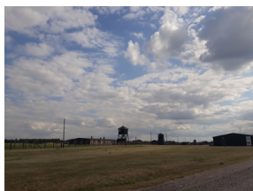
Objazd edukacyjny zagranicznych edukatorów w ramach szkolenia „Poland in the Heart of European History” - 18-22 lipca 2019