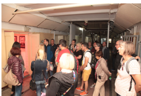
Uczestnicy projektu odwiedzili Muzeum Żołnierzy Wyklętych i Więźniów Politycznych PRL - 23 lipca 2019.