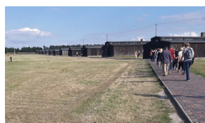
Objazd edukacyjny zagranicznych edukatorów w ramach szkolenia „Poland in the Heart of European History” - 18-22 lipca 2019