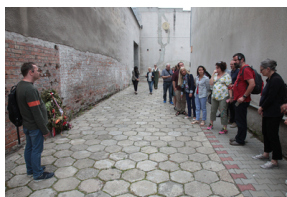
O pracach poszukiwawczych na Rakowieckiej opowiedział