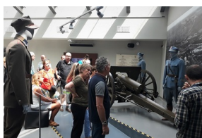
Objazd edukacyjny zagranicznych edukatorów w ramach szkolenia „Poland in the Heart of European History” - 18-22 lipca 2019