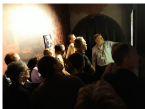
Warsztaty dla nauczycieli i edukatorów podczas seminarium „Poland in the Heart of European History” - 17 lipca 2019