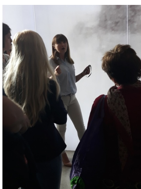
Objazd edukacyjny zagranicznych edukatorów w ramach szkolenia „Poland in the Heart of European History” – 20 lipca 2019