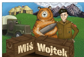
Gra „Miś Wojtek”

Spotkanie z autorami albumu o gen. Józefie Hallerze w ramach Przystanku Historia IPN w Brukseli w Ambasadzie RP