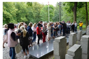
Objazd edukacyjny nauczycieli biorących udział w XIII Polonijnych spotkaniach z historią najnowszą, 5-7 lipca 2019.