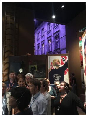
Objazd edukacyjny nauczycieli biorących udział w XIII Polonijnych spotkaniach z historią najnowszą, 5-7 lipca 2019.