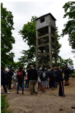
Objazd edukacyjny nauczycieli biorących udział w XIII Polonijnych spotkaniach z historią najnowszą, 5-7 lipca 2019.