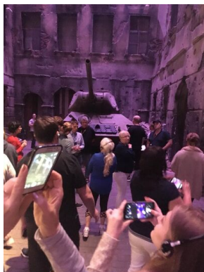
Objazd edukacyjny nauczycieli biorących udział w XIII Polonijnych spotkaniach z historią najnowszą, 5-7 lipca 2019.