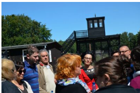
Objazd edukacyjny nauczycieli biorących udział w XIII Polonijnych spotkaniach z historią najnowszą, 5-7 lipca 2019.

oprowadzili nauczycieli polonijnych po terenie byłego obozu koncentracyjnego. Kolejnego dnia uczestnicy konferencji zwiedzili Westerplatte i Muzeum II Wojny Światowej. Oddali także hołd zamordowanym w czasach stalinowskich bohaterom, walczącym z narzuconym siłą systemem komunistycznym i pochowanym na Cmentarzu Garnizonowym w Gdańsku, a także robotnikom protestującym w grudniu 1970 r. Zwiedzili salę BHP w Stoczni Gdańskiej, miejsce podpisania porozumień sierpniowych w 1980 r. 7 lipca nauczyciele polonijni zwiedzili Muzeum Emigracji.