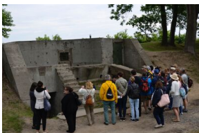
Objazd edukacyjny nauczycieli biorących udział w XIII Polonijnych spotkaniach z historią najnowszą, 5-7 lipca 2019.