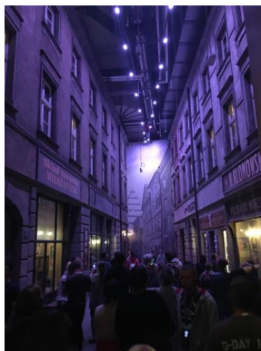
Objazd edukacyjny nauczycieli biorących udział w XIII Polonijnych spotkaniach z historią najnowszą, 5-7 lipca 2019.

Celem konferencji odbywającej się w ramach Programu Polonijnego Biura Edukacji Narodowej IPN jest przede wszystkim wspieranie merytoryczne i metodyczne nauczania najnowszej historii Polski poza granicami kraju. W „Polonijnych spotkaniach z historią najnowszą” uczestniczą wyłącznie nauczyciele praktycy oraz animatorzy edukacyjni – osoby uczące historii i języka polskiego w polskich szkołach, polskich klasach, szkołach parafialnych lub innych polskich placówkach edukacyjnych poza granicami kraju. Zajęciom teoretycznym będą towarzyszyć warsztaty dotyczące m.in. wykorzystania tekstów źródłowych i gier historycznych podczas zajęć lekcyjnych, a także zajęć darmowych.