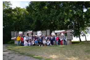
Objazd edukacyjny nauczycieli biorących udział w XIII Polonijnych spotkaniach z historią najnowszą, 5-7 lipca 2019.