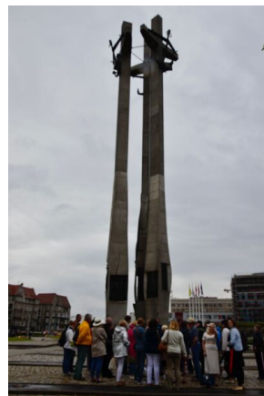
Objazd edukacyjny nauczycieli biorących udział w XIII Polonijnych spotkaniach z historią najnowszą, 5-7 lipca 2019.