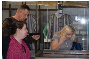
Objazd edukacyjny nauczycieli biorących udział w XIII Polonijnych spotkaniach z historią najnowszą, 5-7 lipca 2019.