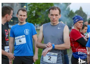
Bieg 3. Monte Cassino.