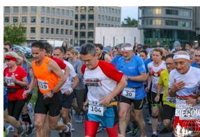
Bieg 3. Monte Cassino.