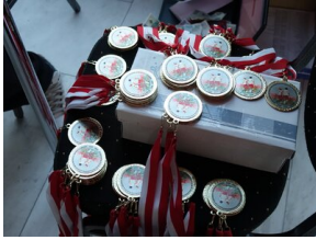
Bieg 3. Monte Cassino.