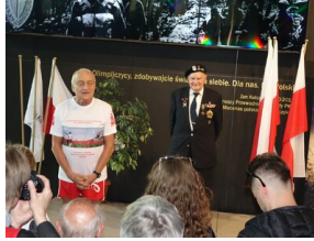
Bieg 3. Monte Cassino.