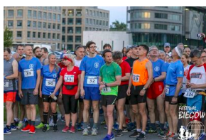
Bieg 3. Monte Cassino.