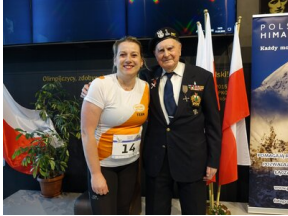
Bieg 3. Monte Cassino.