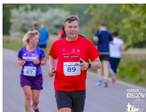
Bieg 3. Monte Cassino.