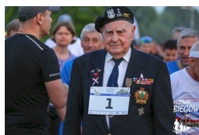
Bieg 3. Monte Cassino.