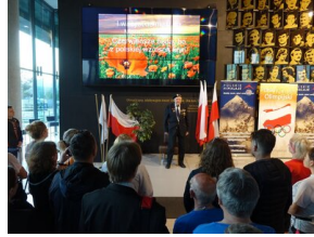
Bieg 3. Monte Cassino.