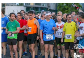
Bieg 3. Monte Cassino.