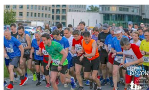
Bieg 3. Monte Cassino.