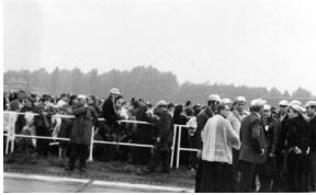
Zdjęcie ze spotkania z papieżem w Katowicach-Muchowcu, 20 czerwca 1983 r. (AIPN Ka 030/177, t. 3, k. 98/31)