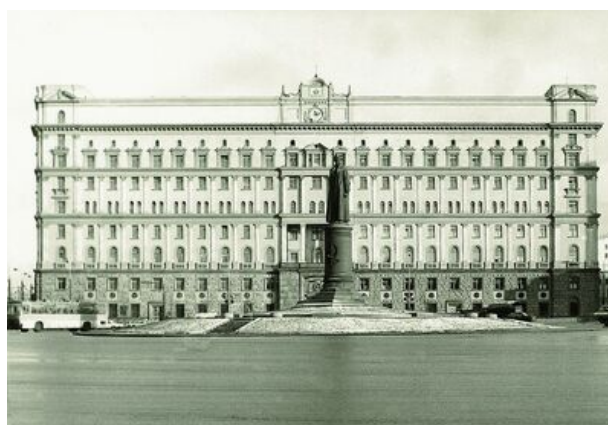
Łubianka, siedziba NKWD i więzienie śledcze w Moskwie, dokąd przewieziono z Polski gen. Okulickiego i innych przywódców Polskiego Państwa Podziemnego