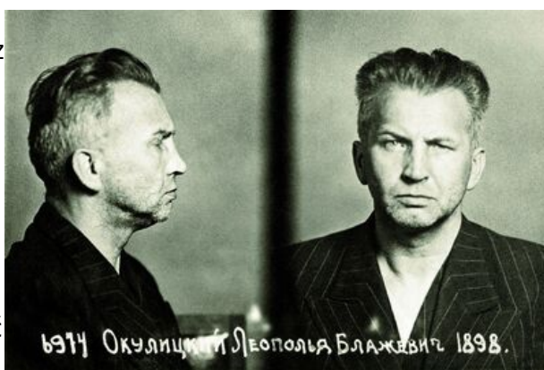
Fotografia więzienna gen. Okulickiego wykonana w więzieniu NKWD na Łubiance