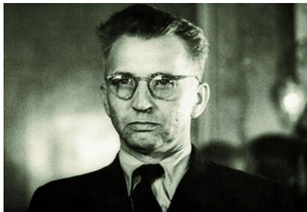
Gen. Okulicki przed Kolegium Wojskowego Sądu Najwyższego ZSRS

„Stan więźnia Okulickiego pozostawał ciężki. Tony serca były lekko słyszalne, tętno słabe, nitkowate, pojawiła się sinica kończyn i twarzy. O godz. 9 rano 24 grudnia 1946 r. stan gwałtownie się pogorszył” – napisano w wydanym po operacji zaświadczeniu lekarskim. Problemy pacjenta tłumaczono