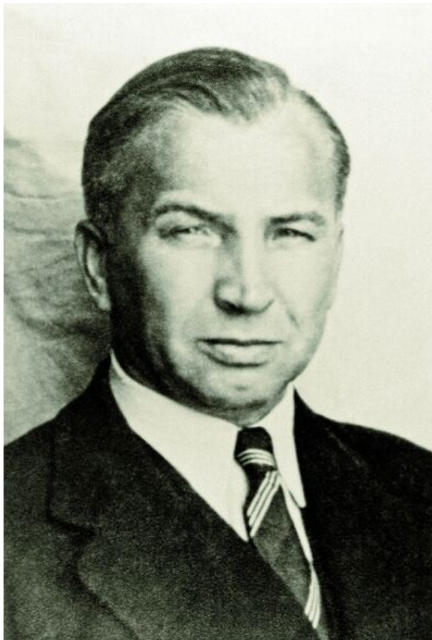
Gen. Leopold Okulicki, ostatni komendant główny Armii Krajowej

Władze sowieckie długo ukrywały śmierć generała - poinformowały o niej dopiero w 1956 roku, na prośbę Szwedzkiego Czerwonego Krzyża, starającego się wyjaśnić okoliczności śmierci więźniów politycznych, sądzonych w Moskwie w czerwcu 1945 roku. W odpowiedzi wystosowanej 8 czerwca 1956 roku strona sowiecka, reprezentowana przez Komitet Wykonawczy Czerwonego Krzyża i Czerwonego Półksiężyca ZSRS, poinformowała o paraliżu i ataku serca jako