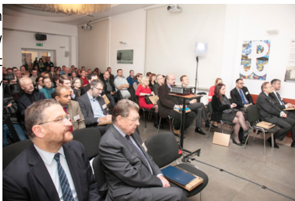
Sala obrad w centrum konferencyjnym IPN