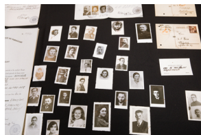
Prezentacja Listy Ładosia - Warszawa, 12 grudnia 2019.

Pracownicy Archiwum Instytutu Pamięci Narodowej sprawdzili łącznie 1843 nazwiska oraz znaleźli 17 tysięcy stron dokumentów o 998 osobach.