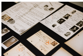
Prezentacja Listy Ładosia - Warszawa, 12 grudnia 2019.