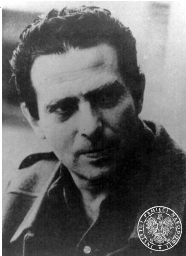
Karol Modzelewski - członek Prezydium Zarządu Regionu NSZZ „Solidarność” Region Dolny Śląsk