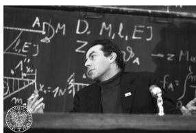
Karol Modzelewski na spotkaniu w auli Politechniki Warszawskiej, 1980 r.