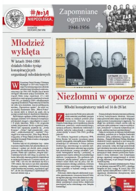
Dodatek specjalny IPN „Zapomniane ogniwo 1944-1956” – „Nasz Dziennik”, 1 marca 2019