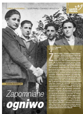
Dodatek specjalny IPN „Armia Niezłomna” – „Gazeta Polska”, 27 lutego 2019

W związku z Narodowym Dniem Pamięci Żołnierzy Wyklętych Instytut Pamięci Narodowej przygotował specjalne dodatki historyczne do „ Naszego Dziennika ”, i „ Gościa Niedzielnego ”, IPN jest także partnerem dodatku do tygodnika „ Gazeta Polska ”.