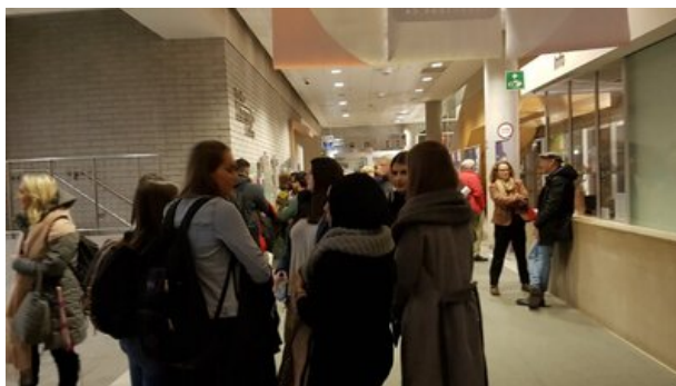
Otwarcie wystawy „Polacy ratujący Żydów w czasie II wojny światowej”. Ottawa, 4 grudnia 2018