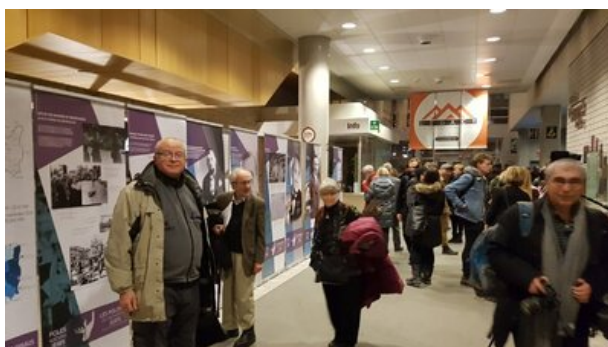
Otwarcie wystawy „Polacy ratujący Żydów w czasie II wojny światowej”. Ottawa, 4 grudnia 2018