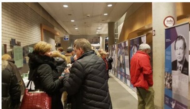
Otwarcie wystawy „Polacy ratujący Żydów w czasie II wojny światowej”. Ottawa, 4 grudnia 2018