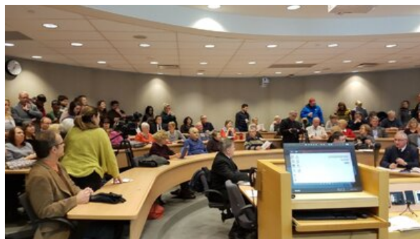
Otwarcie wystawy „Polacy ratujący Żydów w czasie II wojny światowej”. Ottawa, 4 grudnia 2018