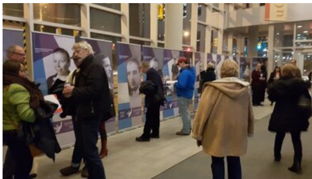
Otwarcie wystawy „Polacy ratujący Żydów w czasie II wojny światowej”. Ottawa, 4 grudnia 2018

pt. „Żegota” – Rada Pomocy Żydom”. Jej autorami są dr Marcin Urynowicz i dr Paweł Rokicki (IPN). Ekspozycja opowiada o powstaniu i działalności „Żegoty”, przypomina jej głównych bohaterów oraz sylwetki niektórych podopiecznych. W 2018 r. ekspozycję pokazywano m.in. w Sejmie RP, w Muzeum im. Rodziny Ulmów w Markowej, w Lublinie, Katowicach, Krakowie i