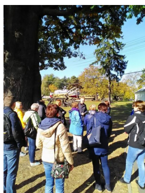
Seminarium dla nauczycieli w Muzeum Orła Białego w Skarżysku-Kamiennej