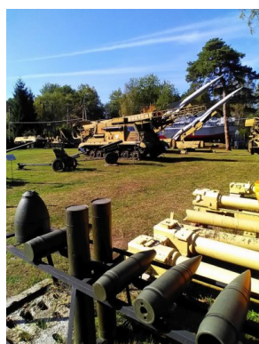
Seminarium dla nauczycieli w Muzeum Orła Białego w Skarżysku-Kamiennej

Cały cykl przewidziany jest na 8 spotkań. Kolejne już 15 listopada w Muzeum Miasta Warszawy.