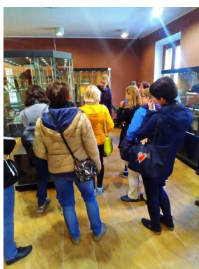
Seminarium dla nauczycieli w Muzeum Orła Białego w Skarżysku-Kamiennej