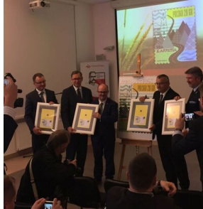
Konferencja popularnonaukowa „Polska – Poczta – Państwo: dzieje narodowej tożsamości” – Warszawa, 3 października 2018