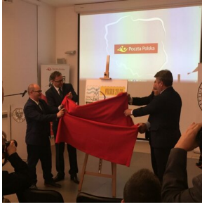
Konferencja popularnonaukowa „Polska – Poczta – Państwo: dzieje narodowej tożsamości” – Warszawa, 3 października 2018