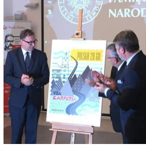
Konferencja popularnonaukowa „Polska – Poczta – Państwo: dzieje narodowej tożsamości” – Warszawa, 3 października 2018