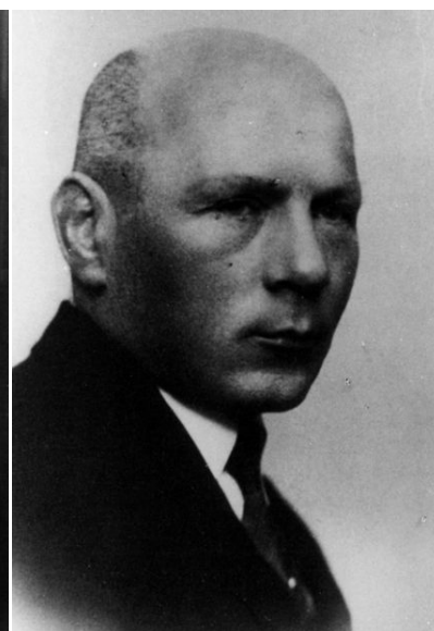
Stanisław Pigoń, kurator tajnego Bratniaka