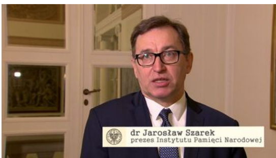
dr Jarosław Szarek prezes Instytutu Pamięci Narodowej