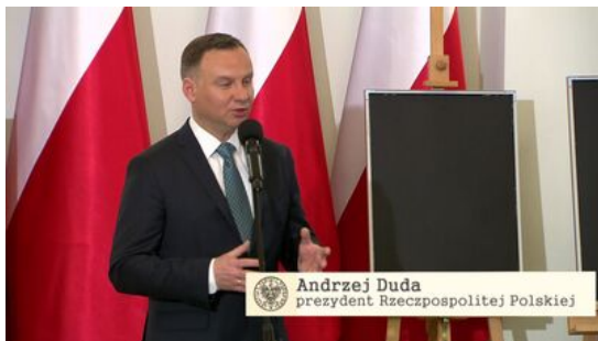
Andrzej Duda prezydent Rzeczypospolitej Polskiej