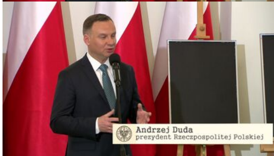
Andrzej Duda prezydent Rzeczypospolitej Polskiej