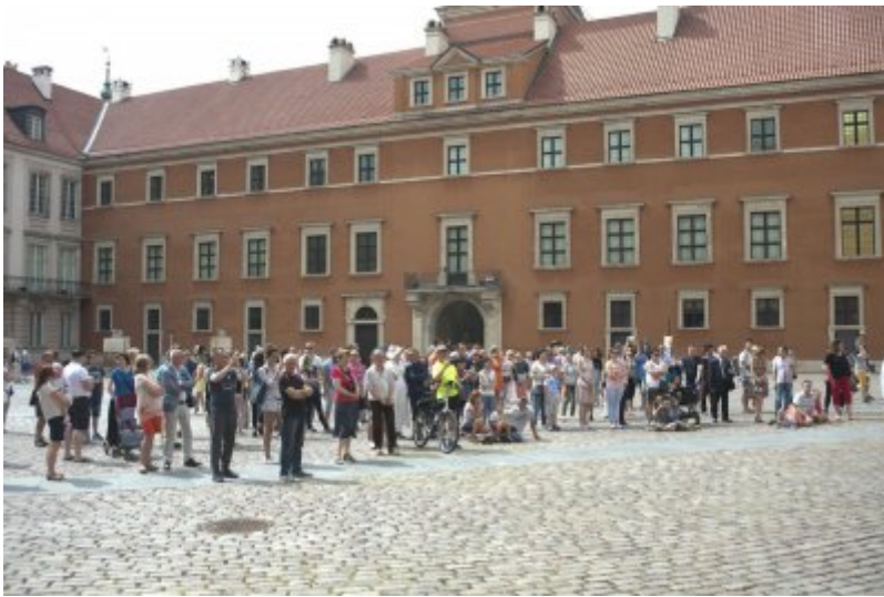
Otwarcie wystawy IPN „O

Niepodległą. Rok 1914” na Zamku Królewskim w Warszawie