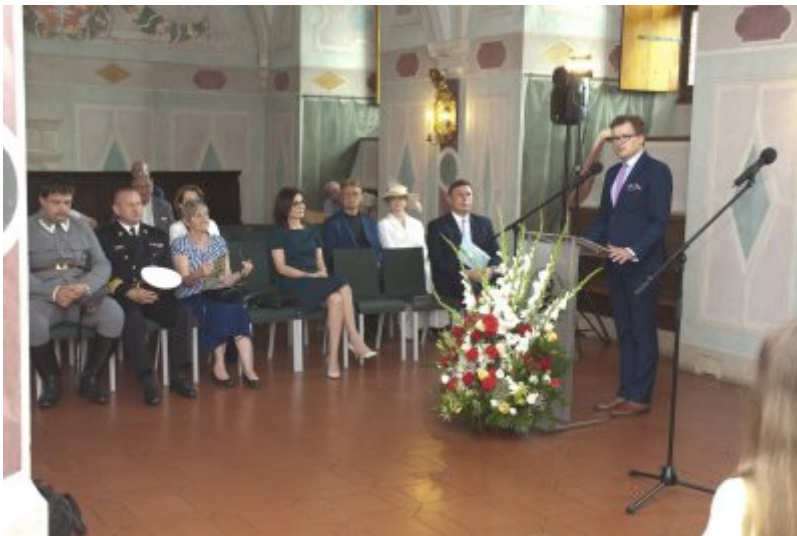
Otwarcie wystawy IPN „O Niepodległą. Rok 1914” na Zamku Królewskim w Warszawie