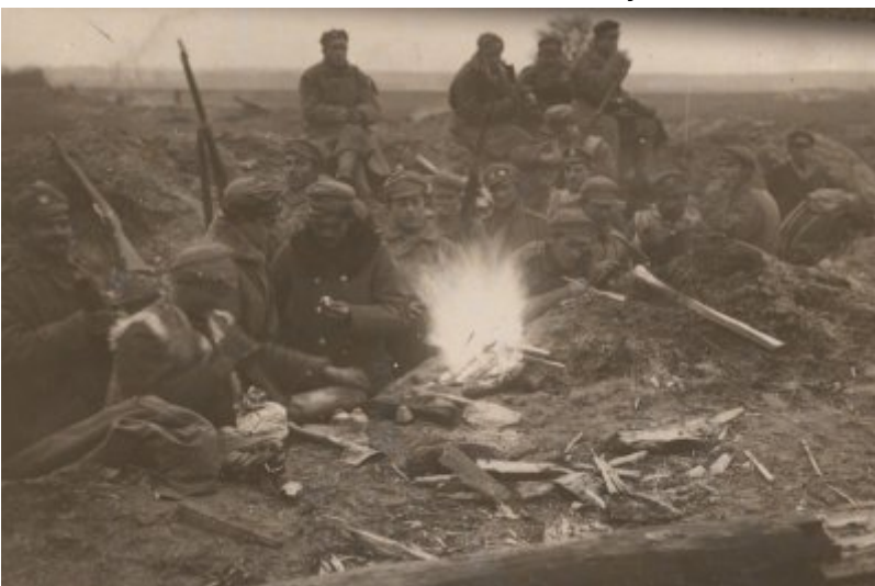
Żołnierze 1 pułku piechoty Legionów Polskich przy ognisku, 1916 r. (zbiory Jerzego Kirszaka)