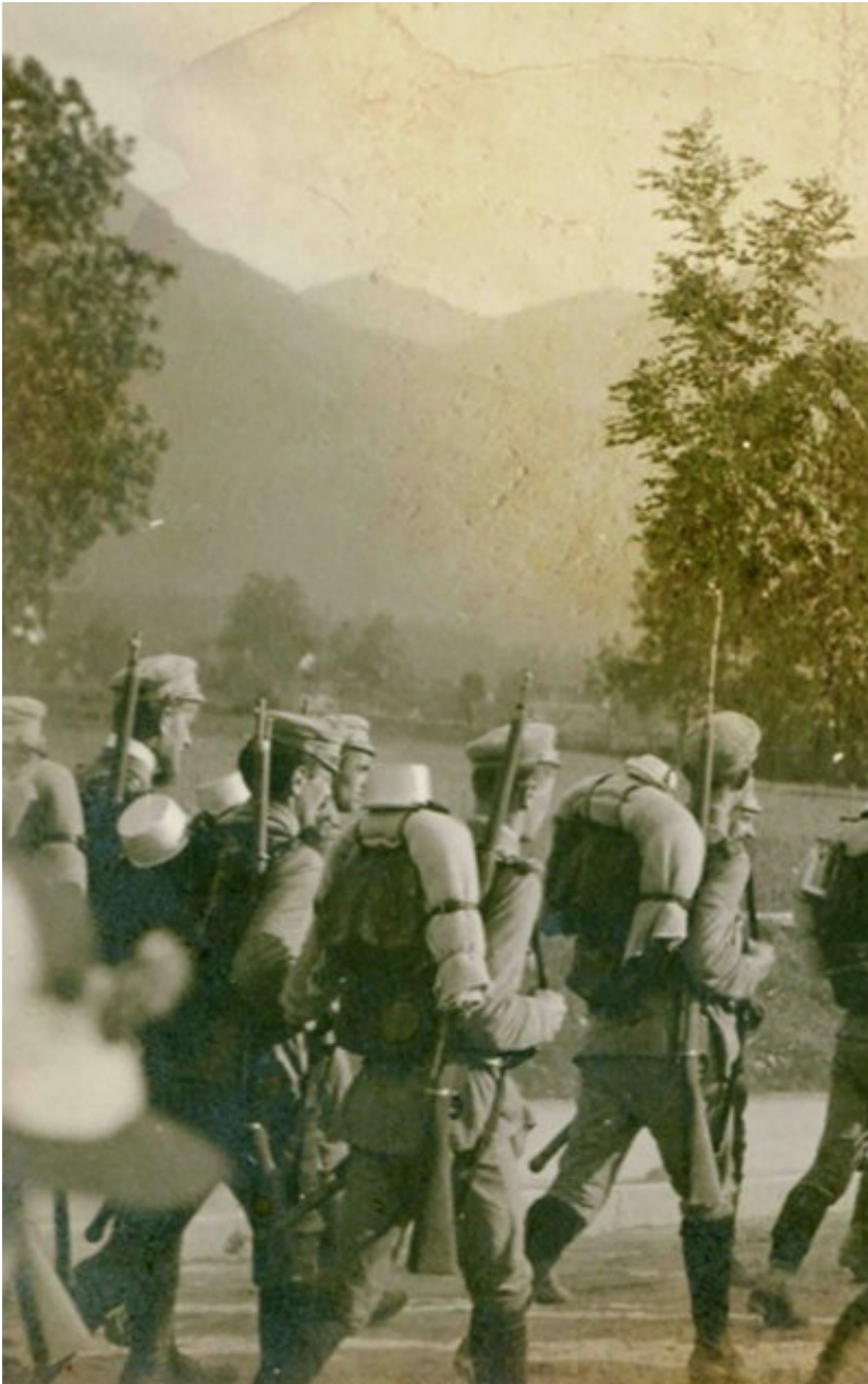
Wejście kompanii Związku Strzeleckiego do Zakopanego, sierpień 1913 r.