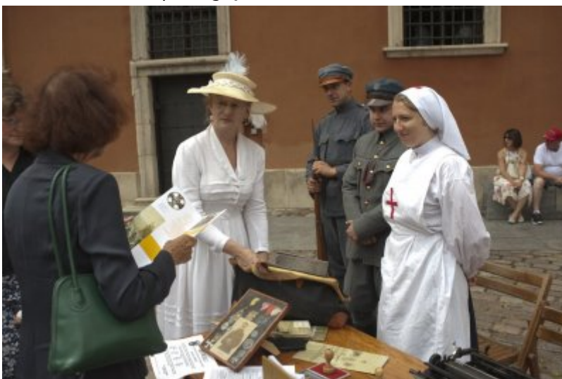
Otwarcie wystawy IPN „O Niepodległą. Rok 1914” na Zamku Królewskim w Warszawie