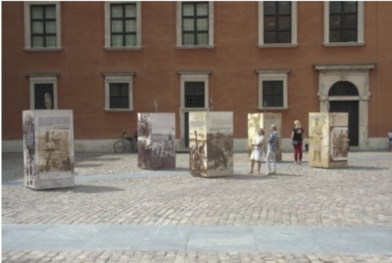
Otwarcie wystawy IPN „O Niepodległą. Rok 1914” na Zamku Królewskim w Warszawie