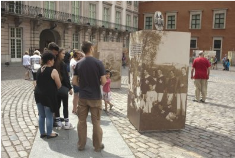
Otwarcie wystawy IPN „O

Niepodległą. Rok 1914” na Zamku Królewskim w Warszawie