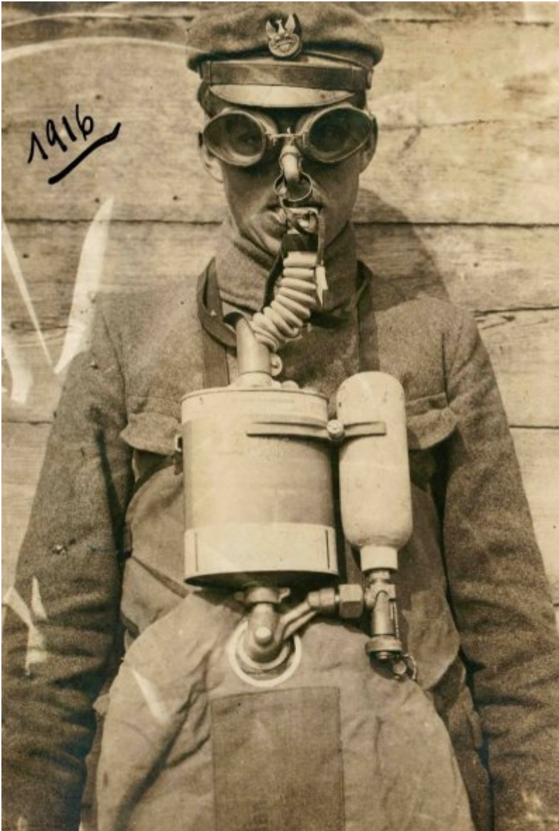
Żołnierz I Brygady Legionów w masce przeciwważowej