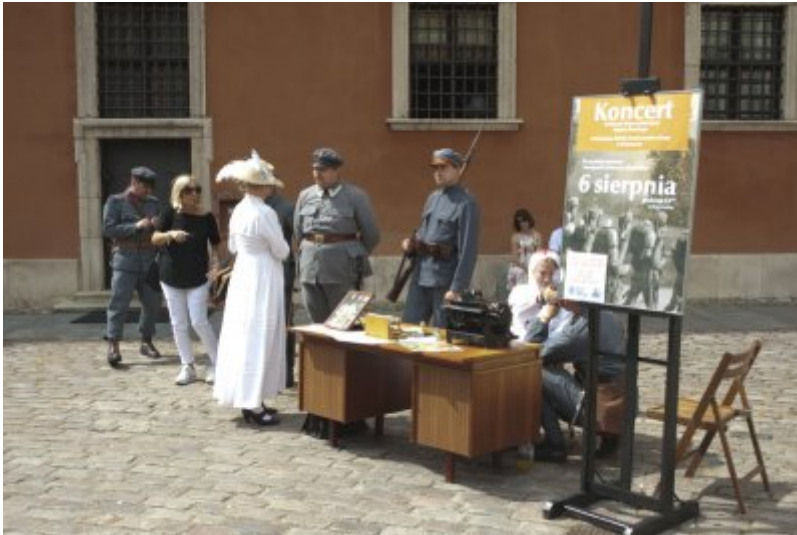
Otwarcie wystawy IPN „O

Niepodległą. Rok 1914” na Zamku Królewskim w Warszawie