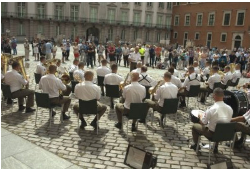
Otwarcie wystawy IPN „O Niepodległą. Rok 1914” na Zamku Królewskim w Warszawie