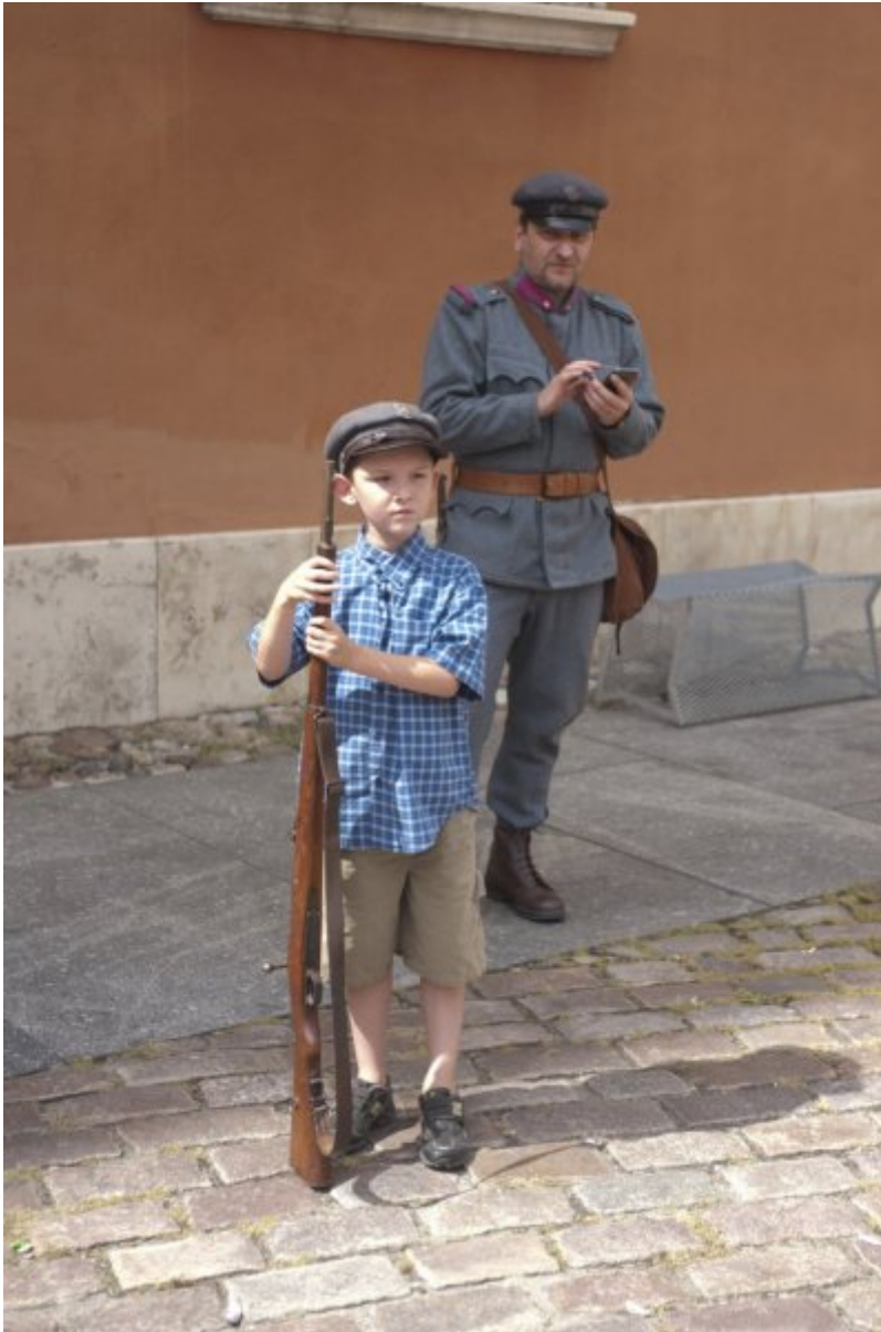
Otwarcie wystawy IPN „O Niepodległą. Rok 1914” na Zamku Królewskim w Warszawie