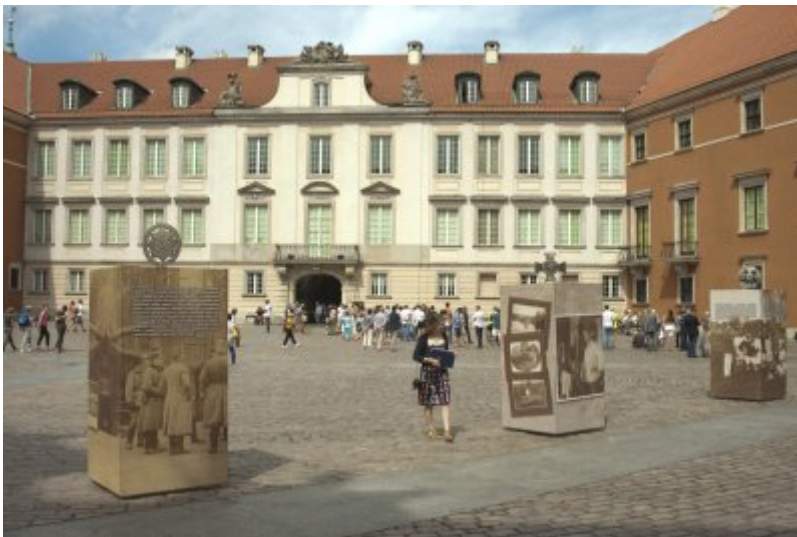
Otwarcie wystawy IPN „O Niepodległą. Rok 1914” na Zamku Królewskim w Warszawie