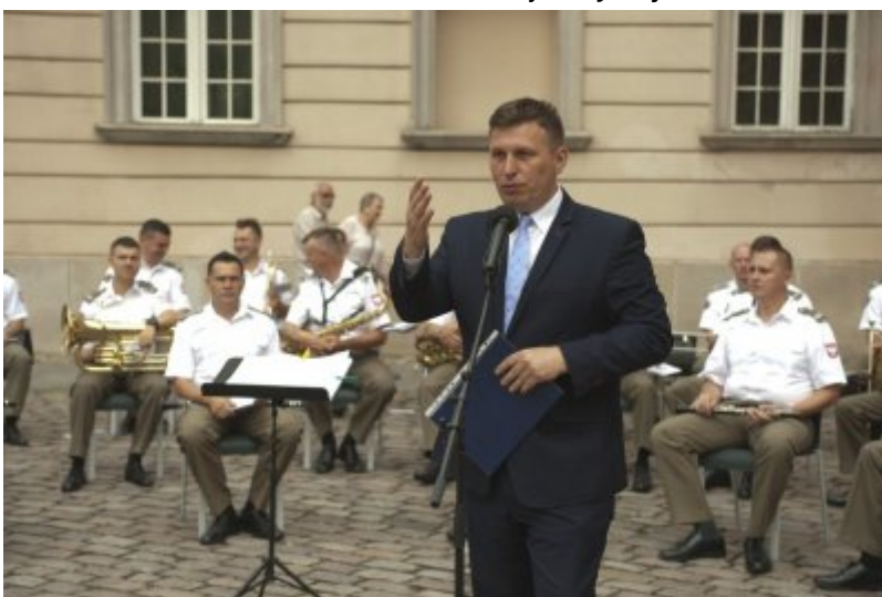
Otwarcie wystawy IPN „O Niepodległą. Rok 1914” na Zamku Królewskim w Warszawie