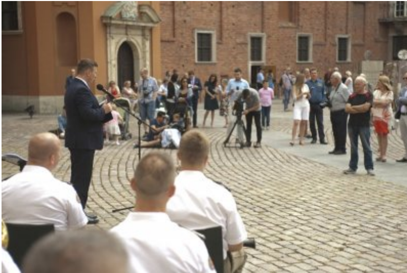
Otwarcie wystawy IPN „O Niepodległą. Rok 1914” na Zamku Królewskim w Warszawie