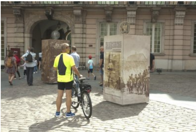
Otwarcie wystawy IPN „O

Niepodległą. Rok 1914” na Zamku Królewskim w Warszawie