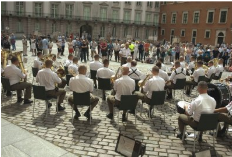
Otwarcie wystawy IPN „O Niepodległą. Rok 1914” na Zamku Królewskim w Warszawie