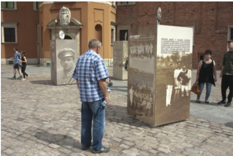
Otwarcie wystawy IPN „O Niepodległą. Rok 1914” na Zamku Królewskim w Warszawie