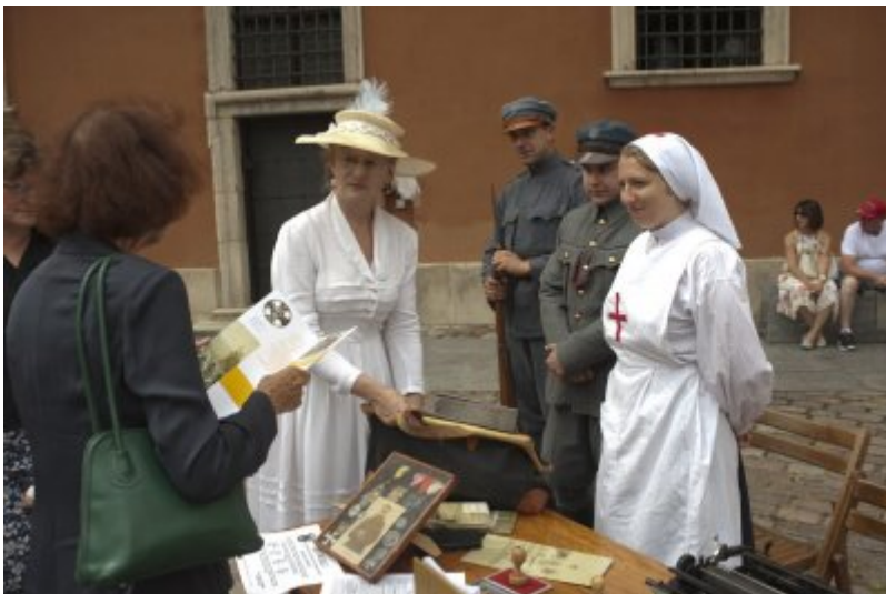
Otwarcie wystawy IPN „O Niepodległą. Rok 1914” na Zamku Królewskim w Warszawie