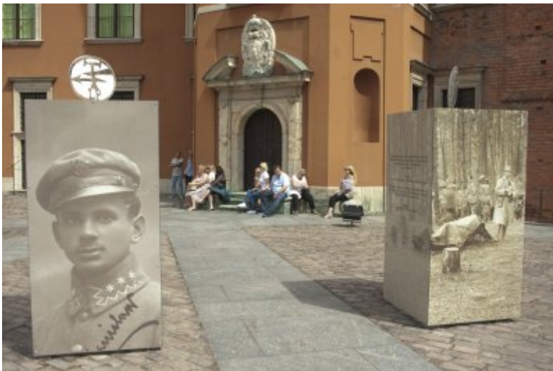
Otwarcie wystawy IPN „O

Niepodległą. Rok 1914” na Zamku Królewskim w Warszawie