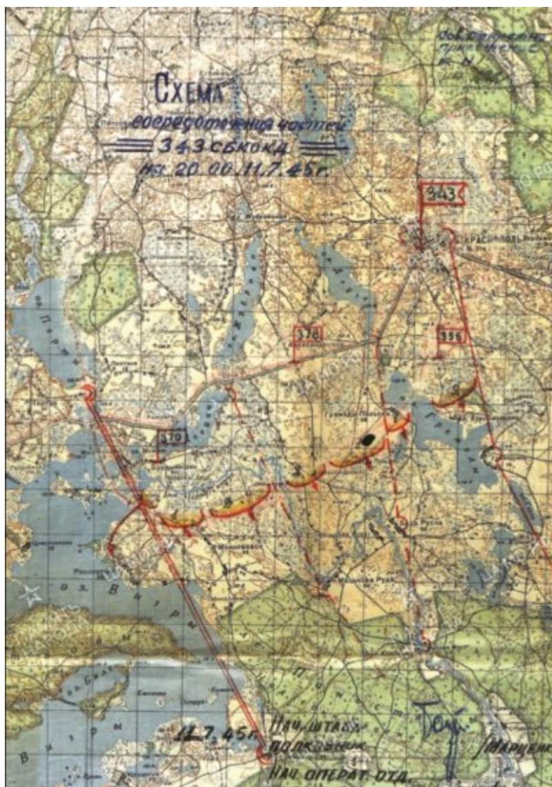
Mapa-schemat rozśrodkowania jednostek sowieckich podczas akcji przeciw żołnierzom podziemia niepodległościowego, 11 VII 1945 r.