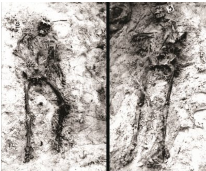
Prace ekshumacyjne w Gibach, 1987