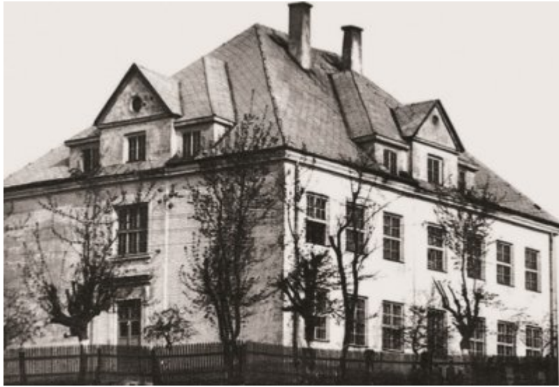
Budynek szkoły w Wiżajnach, gdzie przetrzymywano zatrzymanych w obławie