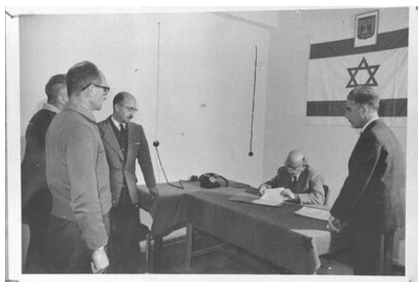
Adolf Eichmann (z lewej) oczekuje na przesłuchanie w izraelskim areszcie.