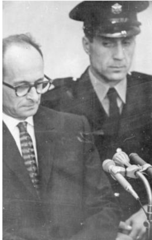
Adolf Eichmann.