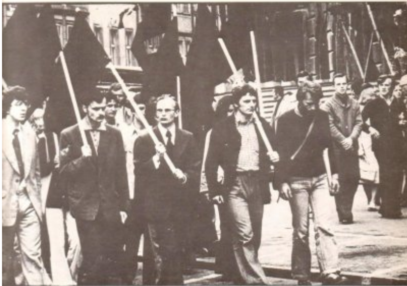
JERZY DCHONSKI 32 Bez tytułu (7 zdjęcie z konkursu)