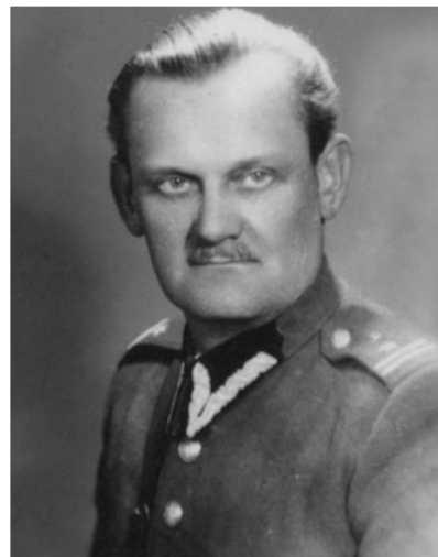
Stefan Długołęcki 1906–1948