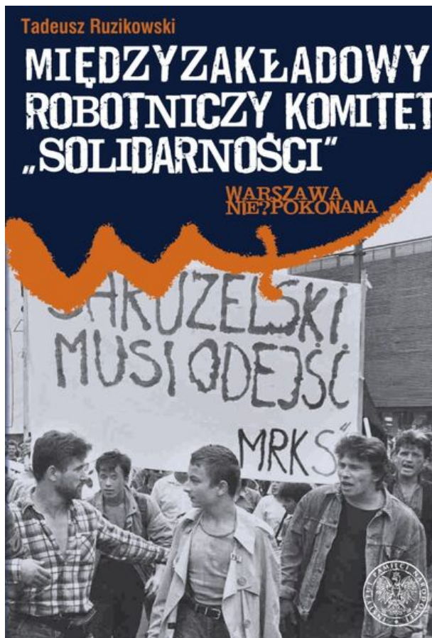
Międzyzakładowy Robotniczy Komitet „Solidarności”

Nagrodę KLIO ustanowiono w 1995 roku staraniem Porozumienia Wydawców Książki Historycznej. Przyznawana jest dorocznie polskim autorom oraz wydawcom za wkład w popularyzację historii.