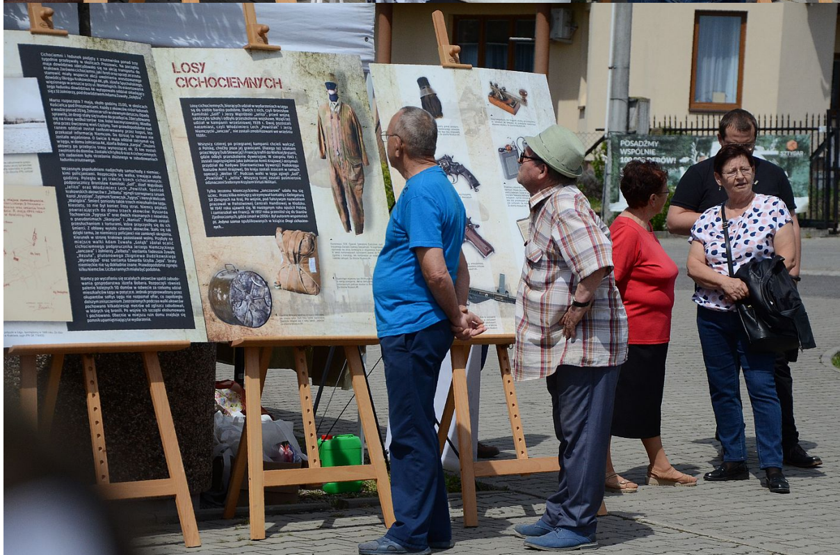
W Makolicach odsłonięto tablicę upamiętniającą zrzut cichociemnych.