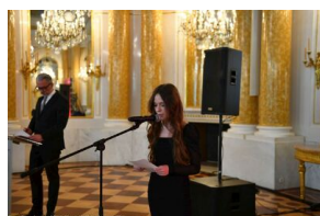
Finał VII edycji projektu edukacyjnego „Łączka i inne miejsca poszukiwań” na Zamku Królewskim w

Wszystkim uczestnikom jeszcze raz serdecznie gratulujemy!