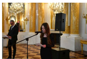
Finał VII edycji projektu edukacyjnego „Łączka i inne miejsca poszukiwań” na Zamku Królewskim w

Wszystkim uczestnikom jeszcze raz serdecznie gratulujemy!