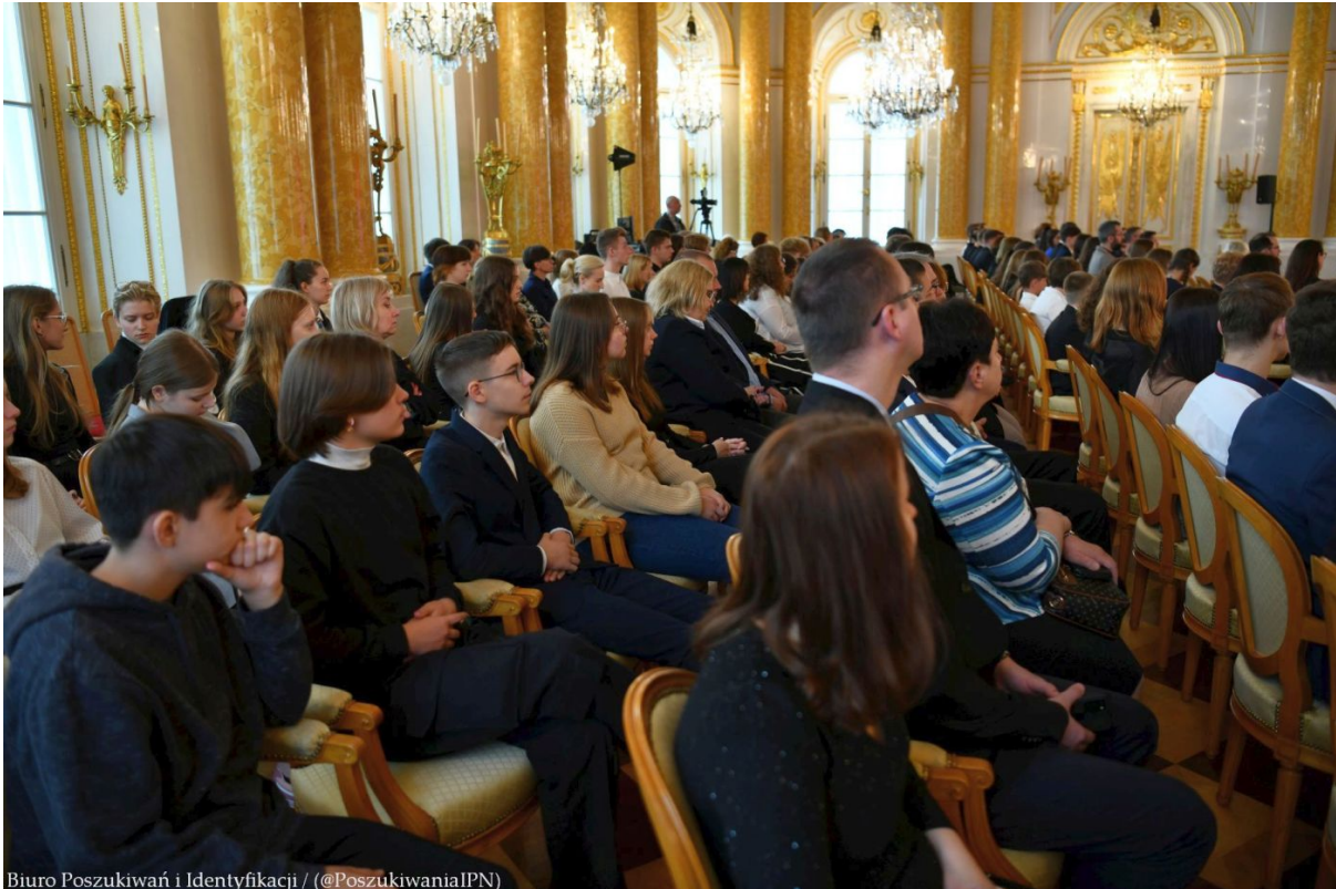
Biuro Poszukiwań i Identyfikacji / (@PoszukiwaniaIPN)

Finał VII edycji projektu edukacyjnego „Łączka i inne miejsca poszukiwań” na Zamku Królewskim w Warszawie – 24 kwietnia 2024. Fot. IPN