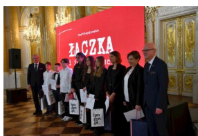
Finał VII edycji projektu edukacyjnego „Łączka i inne miejsca poszukiwań” na Zamku Królewskim w