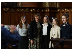
Finał 50. Olimpiady Historycznej – Gdańsk, 14 kwietnia 2024.