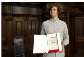
Finał 50. Olimpiady Historycznej – Gdańsk, 14 kwietnia 2024.