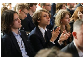
Finał 50. Olimpiady Historycznej – Gdańsk, 14 kwietnia 2024.