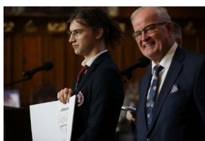
Finał 50. Olimpiady Historycznej – Gdańsk, 14 kwietnia 2024.