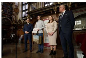
Finał 50. Olimpiady Historycznej – Gdańsk, 14 kwietnia 2024.

Warto podkreślić, że wielu uczniów biorących udział w Olimpiadzie z czasem dołącza do elity intelektualnej Polski – spośród olimpijczyków wywodzi się znaczny procent pracowników naukowych historii uczelni wyższych. Jest to jedno z najważniejszych wydarzeń historycznych organizowanych na terenie naszego kraju.