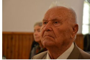
84. rocznica drugiej masowej deportacji Polaków w głąb ZSRS.