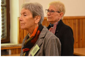
84. rocznica drugiej masowej deportacji Polaków w głąb ZSRS.