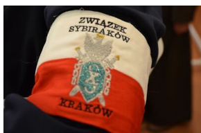
84. rocznica drugiej masowej deportacji Polaków w głąb ZSRS.