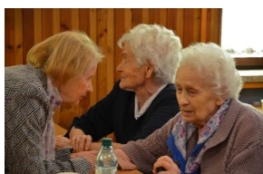
84. rocznica drugiej masowej deportacji Polaków w głąb ZSRS.