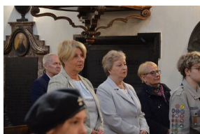
84. rocznica drugiej masowej deportacji Polaków w głąb ZSRS.