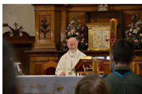
84. rocznica drugiej masowej deportacji Polaków w głąb ZSRS.