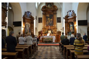
84. rocznica drugiej masowej deportacji Polaków w głąb ZSRS.