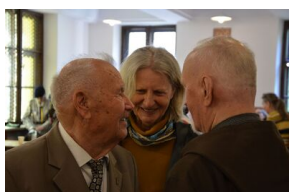
84. rocznica drugiej masowej deportacji Polaków w głąb ZSRS.