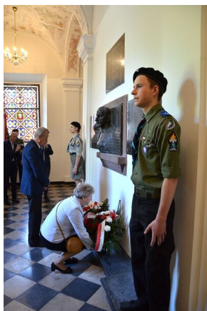
84. rocznica drugiej masowej deportacji Polaków w głąb ZSRS.