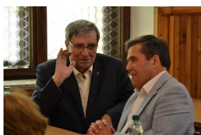
84. rocznica drugiej masowej deportacji Polaków w głąb ZSRS.