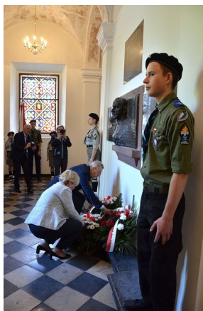
84. rocznica drugiej masowej deportacji Polaków w głąb ZSRS.