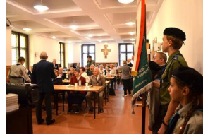
84. rocznica drugiej masowej deportacji Polaków w głąb ZSRS.