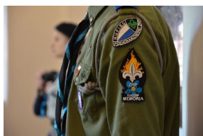
84. rocznica drugiej masowej deportacji Polaków w głąb ZSRS.