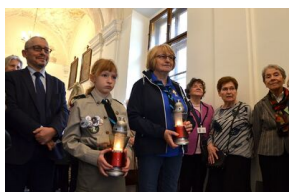
84. rocznica drugiej masowej deportacji Polaków w głąb ZSRS.