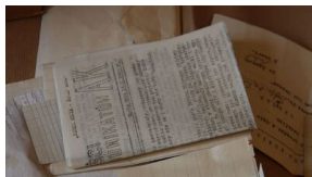
Odnalezione w Olskuszu archiwum 116 pp AK.