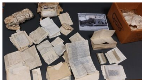
Odnalezione w Olskuszu archiwum 116 pp AK.