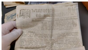
Odnalezione w Olskuszu archiwum 116 pp AK.