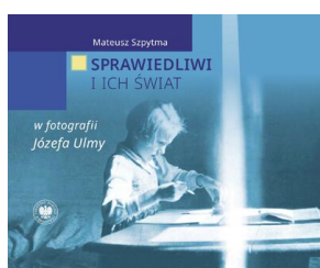
Sprawiedliwi i ich świat