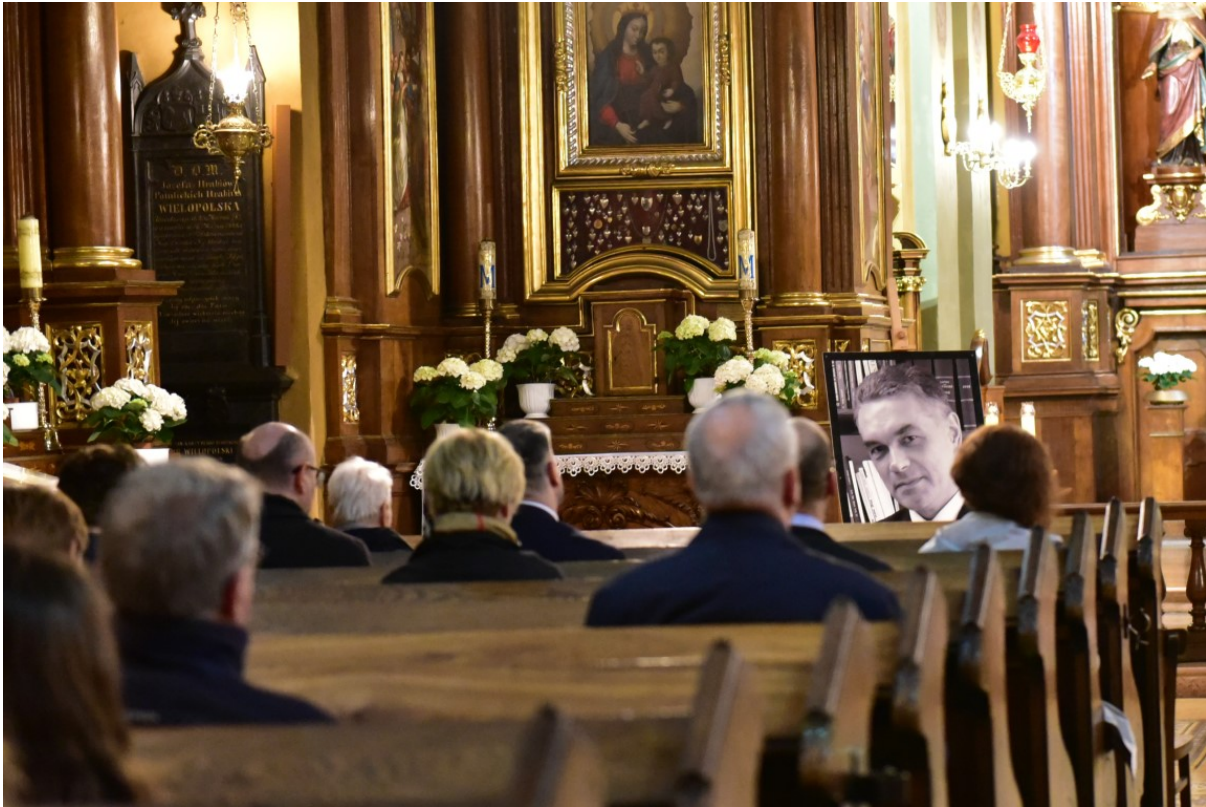
Kierownictwo IPN uczciło w Krakowie ofiary katastrofy smoleńskiej.