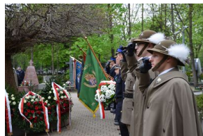
Kierownictwo IPN uczciło w Krakowie ofiary katastrofy smoleńskiej.