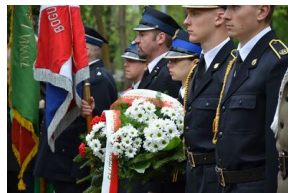
Kierownictwo IPN uczciło w Krakowie ofiary katastrofy smoleńskiej.