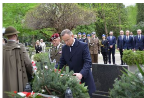
Kierownictwo IPN uczciło w Krakowie ofiary katastrofy smoleńskiej.