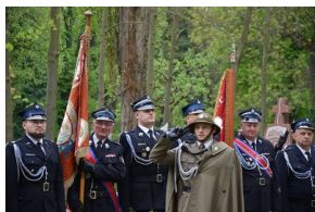
Kierownictwo IPN uczciło w Krakowie ofiary katastrofy smoleńskiej.