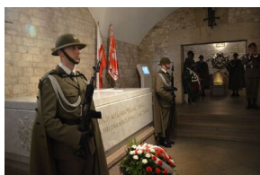
Kierownictwo IPN uczciło w Krakowie ofiary katastrofy smoleńskiej.