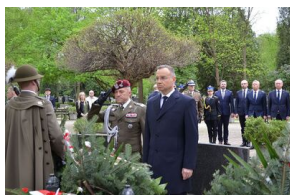
Kierownictwo IPN uczciło w Krakowie ofiary katastrofy smoleńskiej.