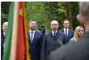
Kierownictwo IPN uczciło w Krakowie ofiary katastrofy smoleńskiej.