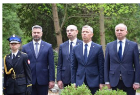
Kierownictwo IPN uczciło w Krakowie ofiary katastrofy smoleńskiej.

Dr hab. Janusz Kurtyka był prezesem IPN w latach 2005-2010 i dyrektorem oddziału w Krakowie w latach 2000-2005. Jest jedną z 96 ofiar tragicznego lotu polskiej delegacji na uroczystości katyńskie.