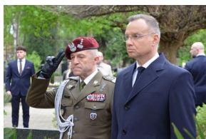
Kierownictwo IPN uczciło w Krakowie ofiary katastrofy smoleńskiej.