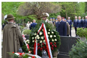
Kierownictwo IPN uczciło w Krakowie ofiary katastrofy smoleńskiej.