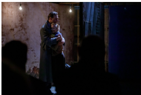
Pokaz spektaklu „Przez ścianę” - Warszawa, 24 kwietnia 2024.