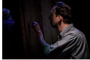
Pokaz spektaklu „Przez ścianę” - Warszawa, 24 kwietnia 2024.