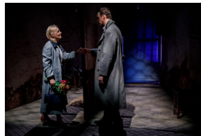
Pokaz spektaklu „Przez ścianę” - Warszawa, 24 kwietnia 2024.