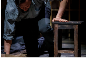
Pokaz spektaklu „Przez ścianę” - Warszawa, 24 kwietnia 2024.