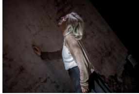
Pokaz spektaklu „Przez ścianę” - Warszawa, 24 kwietnia 2024.