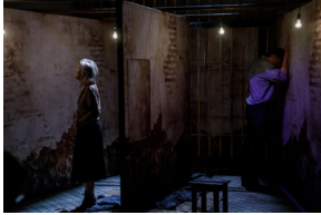
Pokaz spektaklu „Przez ścianę” - Warszawa, 24 kwietnia 2024.