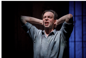
Pokaz spektaklu „Przez ścianę” - Warszawa, 24 kwietnia 2024.