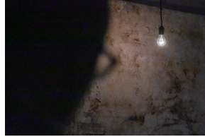
Pokaz spektaklu „Przez ścianę” - Warszawa, 24 kwietnia 2024.