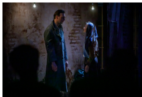
Pokaz spektaklu „Przez ścianę” - Warszawa, 24 kwietnia 2024.