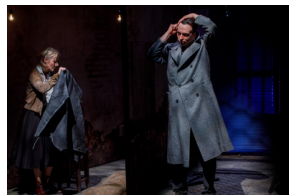
Pokaz spektaklu „Przez ścianę” - Warszawa, 24 kwietnia 2024.