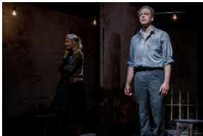
Pokaz spektaklu „Przez ścianę” - Warszawa, 24 kwietnia 2024.