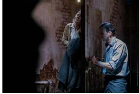
Pokaz spektaklu „Przez ścianę” - Warszawa, 24 kwietnia 2024.