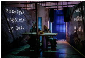
Pokaz spektaklu „Przez ścianę” - Warszawa, 24 kwietnia 2024.