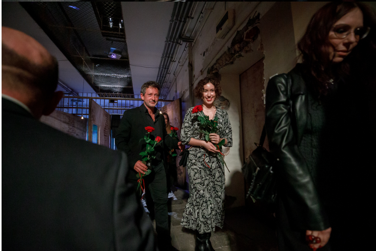
Pokaz spektaklu „Przez ścianę” – Warszawa, 24 kwietnia 2024.