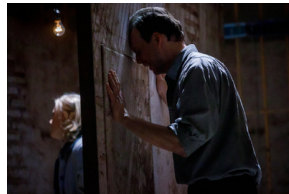
Pokaz spektaklu „Przez ścianę” - Warszawa, 24 kwietnia 2024.