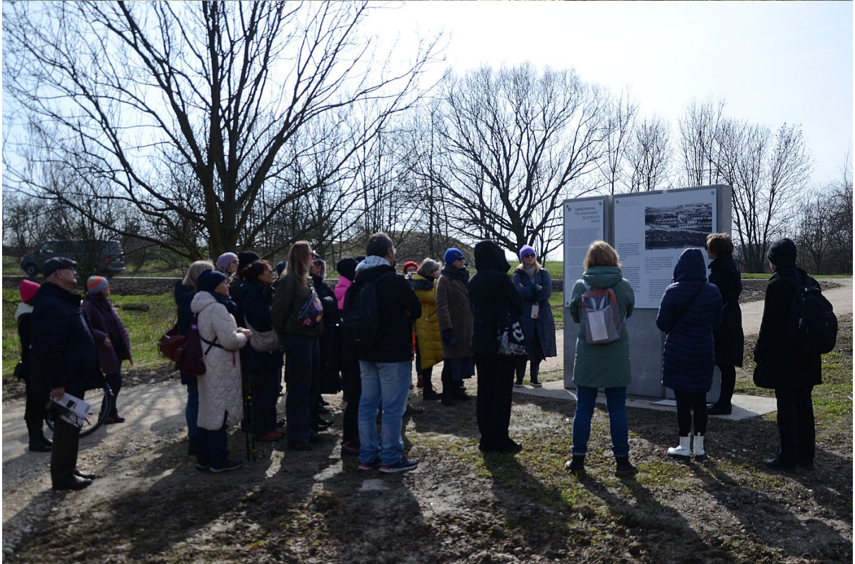
W Krakowie otwarto muzeum KL Plaszow.