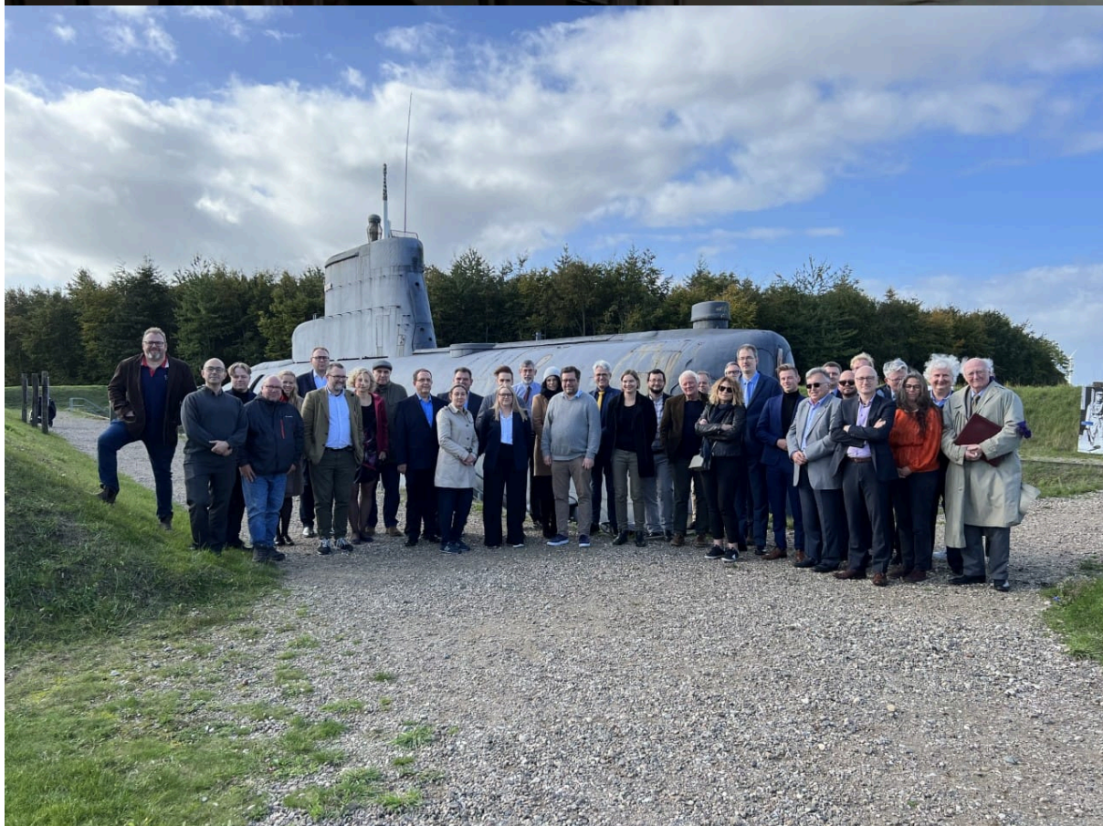
Międzynarodowa konferencja naukowa „Need to Know XI: The Intelligence Legacy of World War II and the Onset of Cold War” – Fort Langeland, 6-7 października 2022.