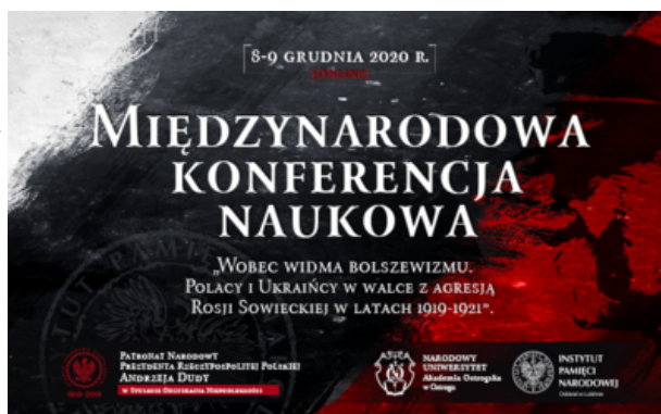
Grafika promująca konferencję naukową „Wobec widma bolszewizmu. Polacy i Ukraińcy w walce z agresją Rosji Sowieckiej w latach 1919-1921”