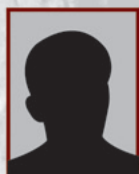
mjr KAZIMIERZ CHRZEŚCZYK s. Teofila ur. b.d. zastępca naczelnika Wydziału III-A SB KW MO w Kielcach – od 1 I 1978 do 1 VI 1980 r.