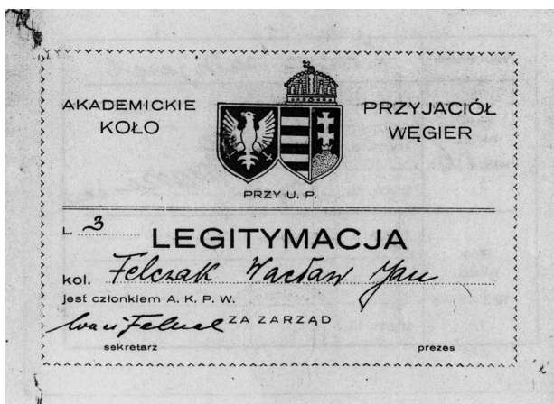
Legitymacja Akademickiego Koła Przyjaciół Węgier przy Uniwersytecie Poznańskim, rok akademicki 1935/36